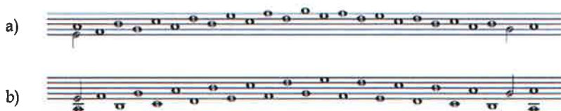
Exemple 2 : Monachus (1963 [c. 1480]), p. 306.

justifie d'ailleurs pas entièrement à travers la cadence 29 . Plus encore, à aucun moment les traités des XIV e et XV e siècles ne prescrivent explicitement la règle de la résolution descendante, règle qui, à ma connaissance n'est pas exposée avant la fin du 16 e siècle chez Avianus 30 . Il est donc nécessaire de se tourner vers le répertoire afin de compléter les informations obtenues.