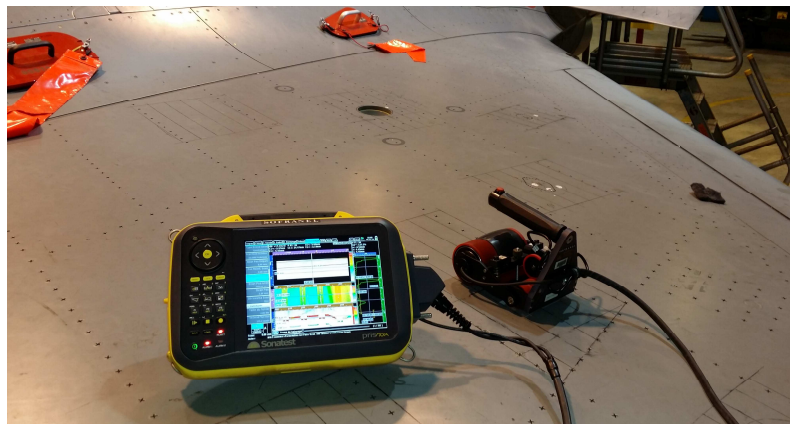
Figure 1.2 Contrôle ultrasonore d'une aile d'avion (SOFRANEL)

Dans un contexte de qualité qui impose la recherche et l'identification de défauts toujours plus petits, sur des matériaux de structure (acier austénitique, matériau composite, béton, etc.) de plus en plus complexes, ces limites intrinsèques peuvent entraîner des difficultés de contrôle parfois insurmontables. Le terme « matériaux de structure » est employé ici pour qualifier des matériaux réels dont la réponse au contrôle n'est pas équivalente à celle d'un matériau parfait. Cette convention est classiquement utilisée dans le domaine du CND.