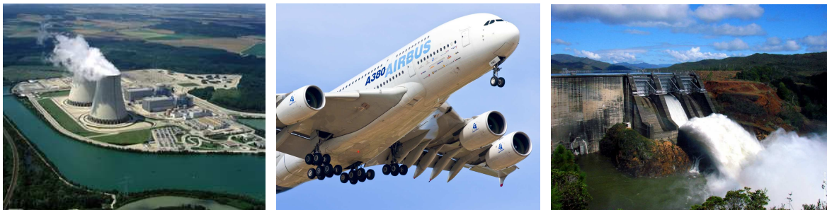
Figure 1.1 Quelques besoins importants de CND.

Le métier du CND s'est historiquement construit autour des activités nucléaires (1950-80), puis celles de l'aéronautique (1980-2000) lorsque les matériaux composites sont apparus. Dernièrement (2000-2010), une nouvelle demande concerne la caractérisation du béton (ouvrages d'art et aussi enceintes de confinement). Ces besoins (fig. 1.1) sont toujours présents, ainsi que de nombreuses autres demandes d'applications industrielles et de R&D, parfois extrêmement complexes.