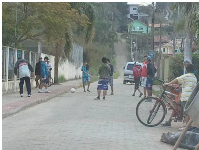
Figure 4. Des adolescents en train de s'amuser devant le portail d'entrée de l'école.

Dans ce récit, la reconnaissance apparaît en tant que demande de type territoriale et environnementale sur laquelle le développement continu rend possible l'existence des habitants et des jeunes en dehors des drogues et de la marginalisation. La reconnaissance constitue un complément de théories de la démocratie (Zask, 2011 : 291). Le souhait d'un don notamment du pouvoir public est une étape indispensable dans la négociation de l'école au nom de la communauté, et donc de reconnaissance. Dans le raisonnement de notre interlocutrice, en connaissance de cause, ces terrains seront « garantis » pour le projet Entorno Escolar seulement avec leur insertion dans le dispositif municipal d'occupation du sol, le Plan directeur d'urbanisation de la ville, en liaison avec la participation et la lutte communautaire. Cependant on voit que la municipalité n'est pas intéressée par ce projet car elle l'a écarté du Plan directeur de la ville approuvé début 2014.