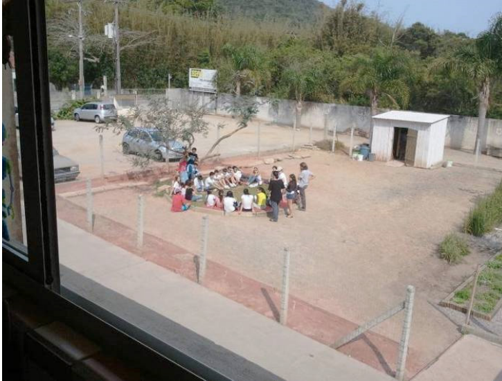
Figure 2. Réalisation du Projet « Plantar e Colher: um jeito de aprende »

C'est dans ce contexte que l'école s'inscrit dans les pratiques liées à l'environnement. Par au-delà de ses murs et par le principe de la logique collective, cette école a l'objectif principal de construire une société de plus en plus critique et engagée à l'éthique et aux valeurs de la nature et du groupe social.