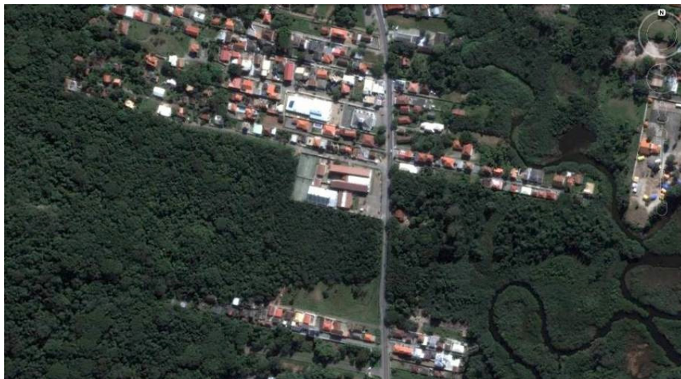
Figure 3. L'école et le corridor écologique vus du haut.

Ainsi, appuyé sur la législation urbaine et environnementale, le projet Entorno Escolar (expliqué en grandes lignes dans l'introduction), conçu par la communauté scolaire, revendiqué depuis 2005 auprès de la mairie de Florianópolis l'expropriation de trois terrains vides situés autour de l'école Dilma Lucia dos Santos, d'à peu près de 100 ha (y compris l'école), qui englobent une diversité d'écosystèmes et de paysages. L'aire configure un Corridor écologique entre deux domaines protégés: le Parc municipal de Lagoa do Péri (2030 ha) et le Parc municipal de Lagoinha do Leste (480,5 ha), qui garantit la liaison entre les écosystèmes marins et côtiers de la Forêt Atlantique.