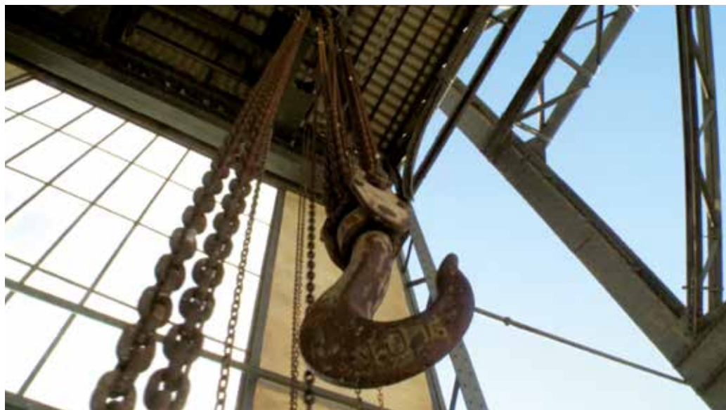
Image extraite du film Bassin minier de Provence. Un creuset pour la recherche , crédits ci-dessous