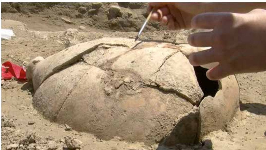
Image extraite du film Lattara, 2600 ans d'Histoire , crédits ci-dessous