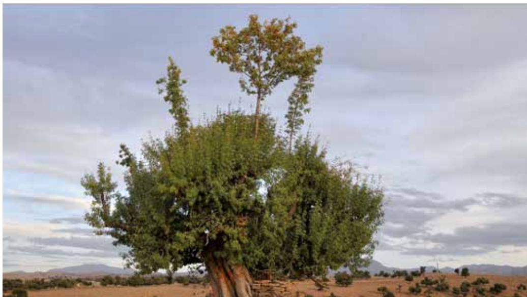
Image extraite du film Bergers sculpteurs d'arbres du Haut Atlas , crédits ci-dessous