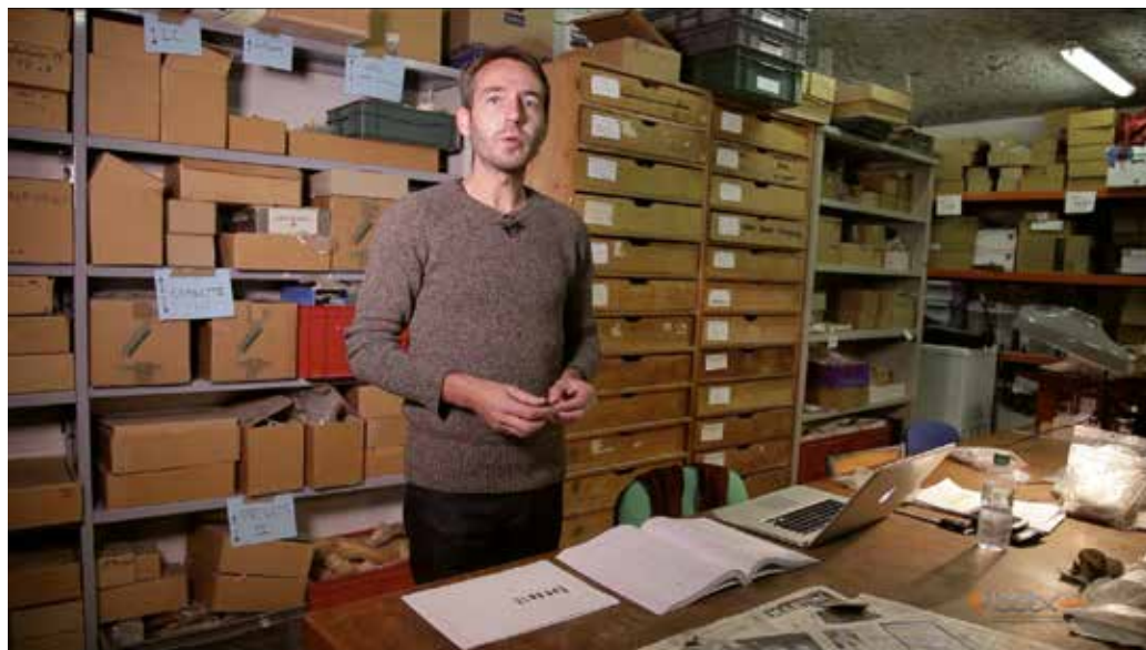
Image extraite de la série Portraits de jeunes chercheurs LabexMed , crédits ci-dessous