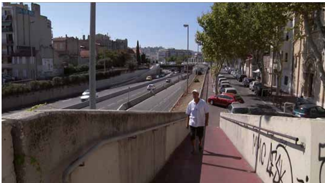
Image extraite du film Petites histoires urbaines. Le temps de la transformation , crédits ci-dessous