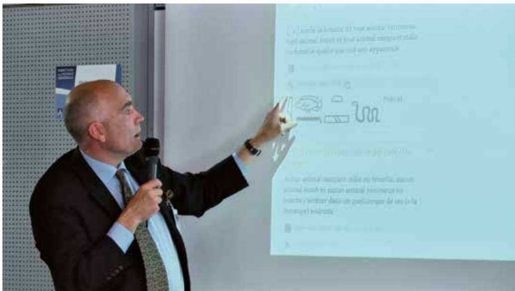
Image extraite du film Le projet VEGa-Vocabulaire de l'Égyptien Ancien , crédits ci-dessous