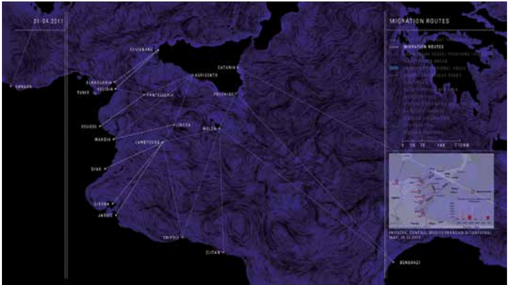
Image extraite du film Liquid Traces - The Left-to-Die Boat Case , crédits ci-dessous