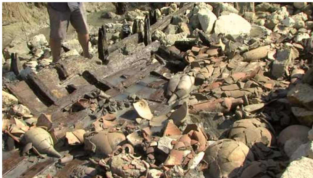
Image extraite du film Ports Antiques de Narbonne , crédits ci-dessous