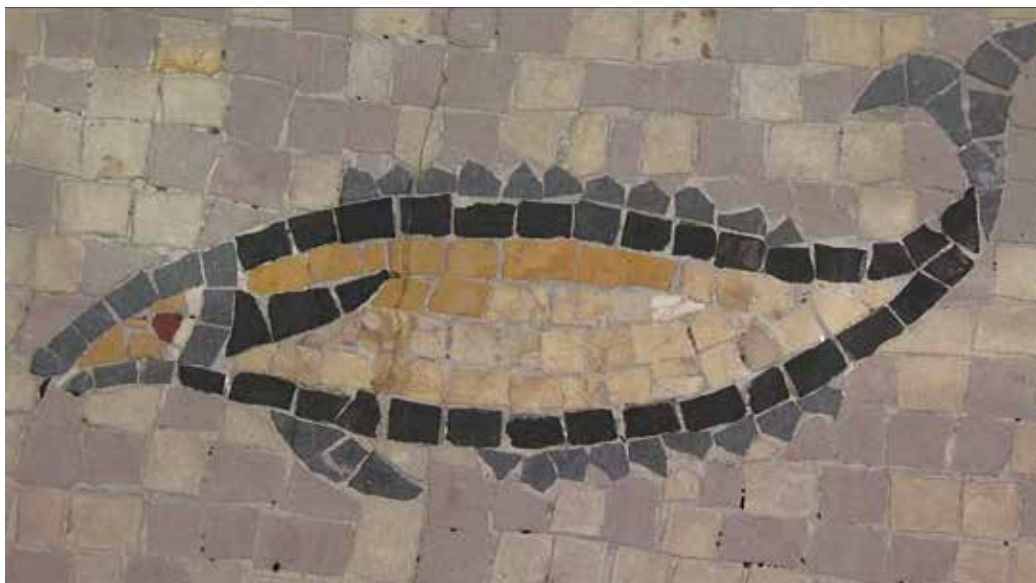
Image extraite du film Archéozoologie, axe transversal entre CNRS et UM3 , crédits ci-dessous