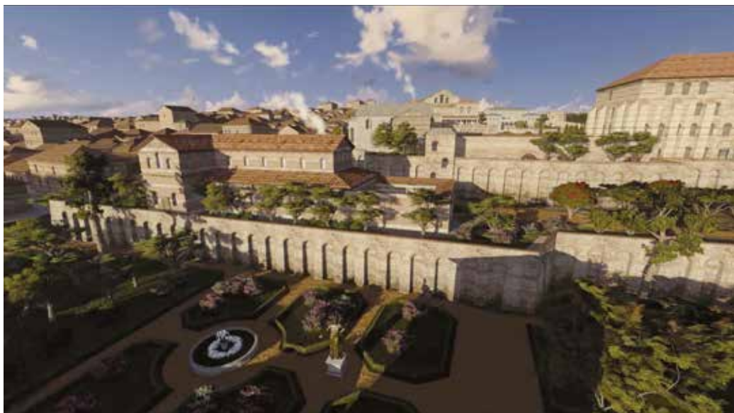
Image extraite du film The Wondrous Waters of Constantinople , crédits ci-dessous