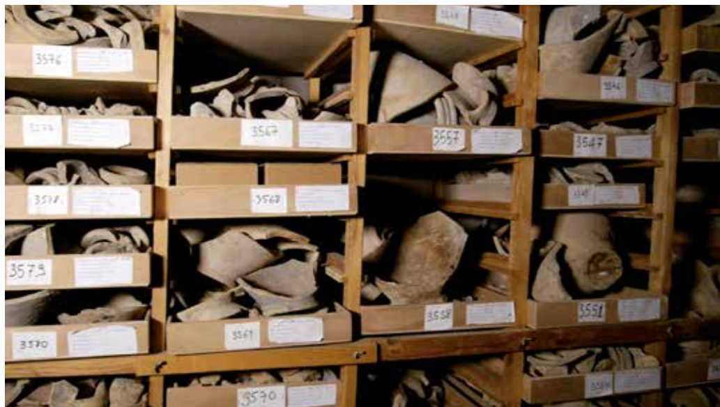
Image extraite du film Le littoral méditerranéen à l'heure de l'Europe celtique - Chantier archéologique du Cailar , crédits ci-dessous