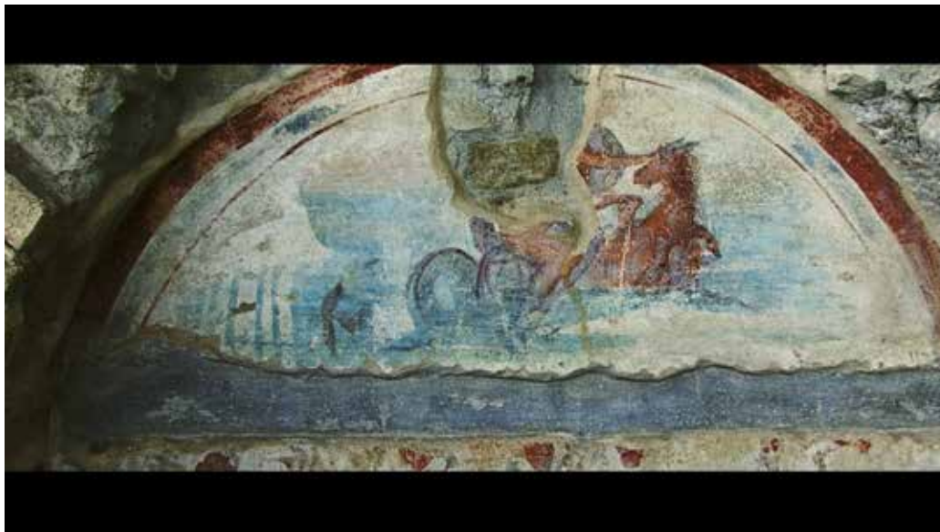
Image extraite du film L'interdisciplinarité au service de l'archéologie . Les peintures murales de la nécropole romaine de Cumae, crédits ci-dessous