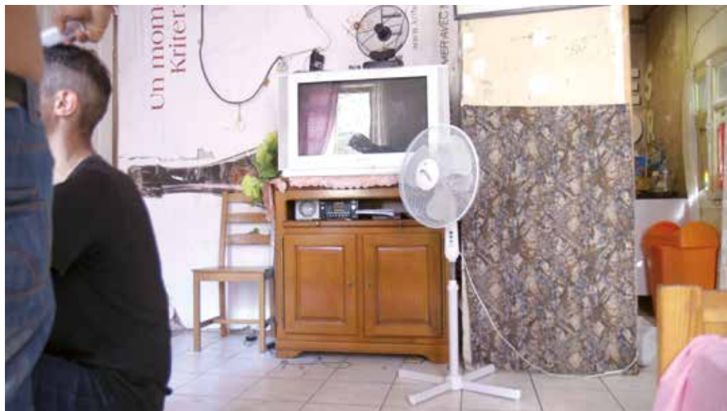
Image extraite du film Entrer, sortir, traverser , crédits ci-dessous