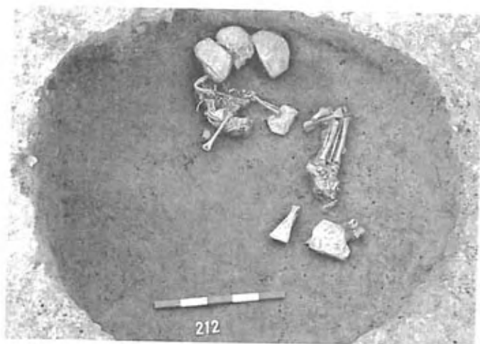
Fig. 199: Le corps déposé dans le silo FS4030.

L'ensilage n'a pas été pratiqué ici en plein champ mais au sein de l'espace domestique, révélé par de nombreux indices au premier rang desquels les puits permettent de déterminer un nombre minimal d'unités d'habitation ou d'exploitation agricole. Non seulement l'ensilage n'est pas établi à l'écart de l'habitat, mais il ne semble pas aménagé exclusivement en plein air comme cela a été envisagé sur d'autres sites (Maufras, Mercier 2006). Une partie des récoltes serait conservée dans des silos abrités sous des auvents ou dans des bâtiments. La variété des situations est peut-être plus grande encore que ne le révèle le sous-sol. Le bâtiment suspecté dans l'aire occidentale a pu également comporter un étage utilisé pour remiser, lui aussi, les récoltes ou le fourrage.