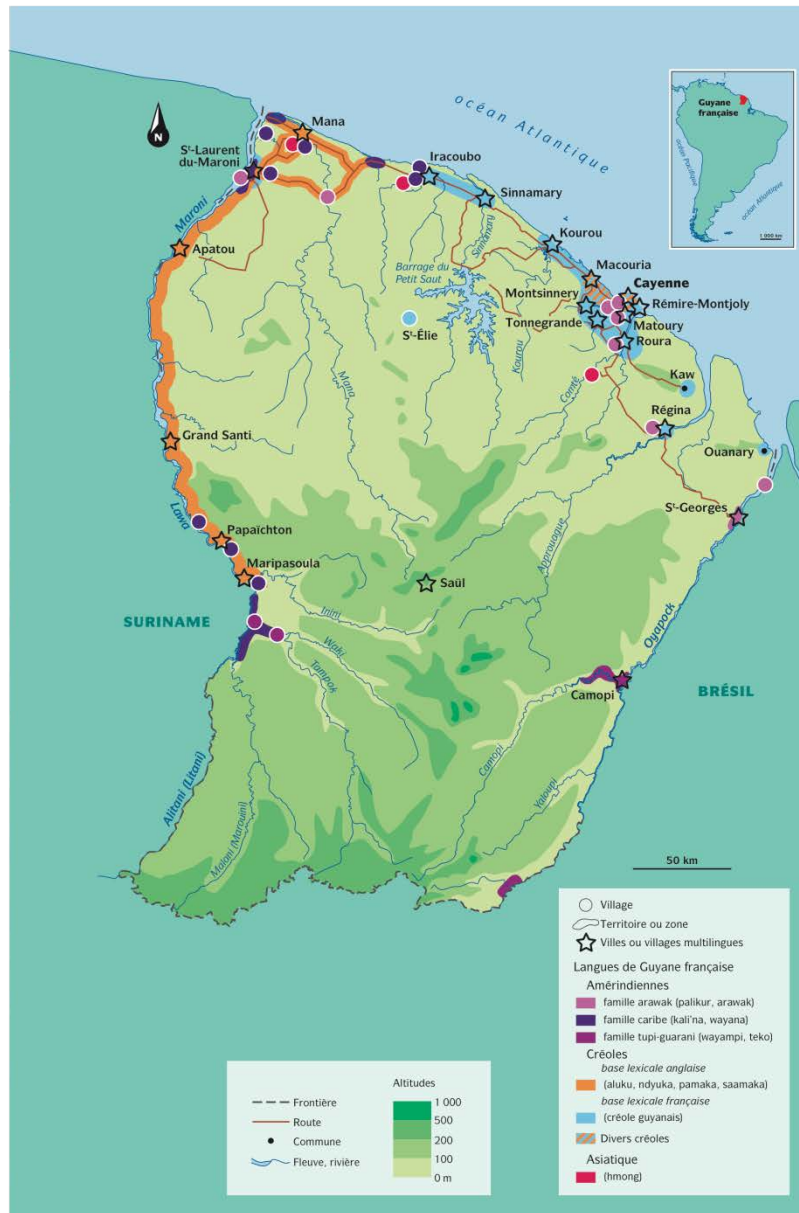
Carte 1 – Les langues de Guyane (Renault-Lescure & Goury, 2009 : 10)

systèmes d'écriture (Goury 2007). La reconnaissance par le Ministère de la Culture et de la Communication de 10 langues parlées en Guyane comme "Langues de France" en atteste également (Alby & Léglise 2005; 2007; Cerquiglini 2003). La carte suivante illustre la présence territoriale de ces 10 langues « locales » reconnues comme « langues de France » et pour lesquelles des formes d'enseignement bilingue ont été mises en place (cf. partie 2 ci-dessous).