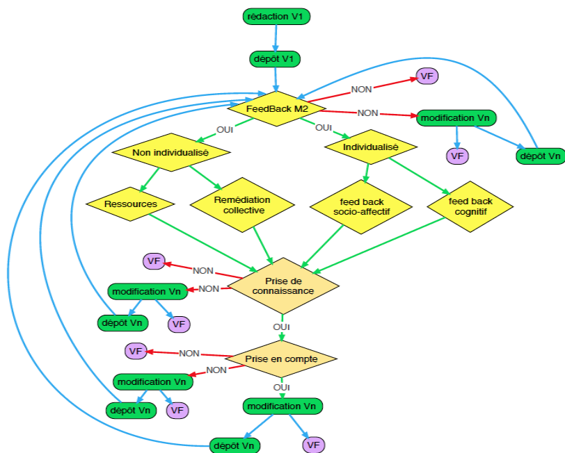
Figure 2 : Scénario d’accompagnement pédagogique Légende : V1 = version 1 ; Vn = version n ; VF = version finale

Quatre types de retours possibles ont été mis en œuvre : le feed-back peut être individualisé, il a alors une dimension cognitive et une dimension socio-affective ; non individualisé, il peut prendre la forme de ressources proposées aux tutorés ou d’une remédiation collective.