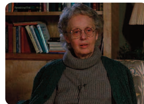
Zelig , Woody Allen

Mais au regard des diverses Apocalypses (2009-...) en série qui enflamment de nos jours le petit écran, force est de constater que le mythe d'un accès direct à l'histoire grâce aux images d'archives est toujours d'actualité et qu'il est plutôt la règle que l'exception 5 . Du côté de l'exception, des réalisateurs comme Sergei Loznitsa, Peter Forgacs ou Caroline Martel s'opposent à cette mythification en revendiquant la subjectivité du regard sur les archives ou en supprimant le commentaire en off 6 . Le caractère expérimental et l'approche « intellectuelle » de ces œuvres expliquent leur réception plutôt confidentielle, qui ne parvient pas à toucher un large public ce qui est l'une des qualités des documenteurs .