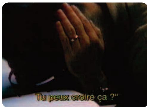
Opération Lune, William Karel

Mais, avec un peu d'antiaméricanisme, on pourrait peut-être y croire. D'ailleurs la BBC n'a pas voulu acheter le film avec l'argument qu'il s'agissait d'une « campagne anti-américaine ». Quand le film montre des images du personnel de la Nasa en train de désespérer face aux commentaires débiles de Neil Armstrong audibles sur la bande sonore, c'est une formidable démonstration de la polyvalence des images qui, dans le contexte original, fort probablement ne montraient que des hommes stressés et fatigués dans le centre de contrôle.