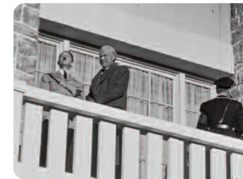
Citizen Kane, Orson Welles

Il y a d'autres films de fiction qui présentent des actualités en mêlant des images d'archives avec des images fictionnelles, à l'instar de A Foreign Affair ( La Scandaleuse de Berlin , 1948) de Billy Wilder. Le personnage principal, la députée du congrès américain Phebe Frost, s'est rendue en Allemagne pour enquêter sur le moral des troupes. Pour mieux comprendre le rôle qu'une chanteuse douteuse a joué sous le Troisième Reich, elle visionne des actualités de l'époque nazie. Celles-ci montrent d'abord des images authentiques d'un discours de Goebbels. Ensuite on voit un sujet sur une soirée à l'opéra où la chanteuse, jouée par Marlene Dietrich, discute avec le Führer. Il n'est dès lors plus possible à Captain Pringle, l'amant actuel de la chanteuse, de cacher son implication dans le système nazi. Cette séquence joue sur le pouvoir du document d'archive comme preuve manifeste et en même temps Wilder remet en question ce pouvoir de manière ironique avec un « vrai » Goebbels et un faux Hitler, signalant ainsi que la possibilité de faire la différence, finalement, n'est pas liée à l'image, mais aux connaissances du spectateur qui sait bien que ni Marlene Dietrich, ni Orson Welles et encore moins Woody Allen n'ont rencontré Hitler.