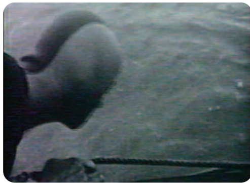
Les Documents interdits, Les Plongeurs, Jean-Teddy Philippe

Les choses se compliquent avec Les Documents interdits , une série de 12 films tournés entre 1986 et 1989 par Jean-Teddy Philippe et diffusés sur Arte en 1989. Le premier film de la série, Les Plongeurs , présente des images amateurs de la disparition d'un plongeur qui est tué par un autre plongeur aux pouvoirs apparemment surnaturels. Il s'agit d'un document monté avec un commentaire en allemand doublé en français, ce qui ajoute un effet d'étrangeté. Le commentaire en sait plus que le spectateur et s'adresse directement à lui avec des phrases comme « Maintenant faites très attention à ce qui va se passer ! », « Regardez le bien ! ». Mais lorsque l'événement se produit, l'image ne nous révèle pas grand chose. Si on y voit un crime ou un phénomène paranormal, cela se passe dans notre tête, parce que le commentaire a orienté notre perception et la diffusion télévisuelle valorise ces images en tant que « documents interdits ». Tout est fait pour que le spectateur croie à l'authenticité de ces documents, dont le caractère non professionnel est souligné par les défauts du cinéma amateur avec l'image tremblante, des mouvements et zooms brusques, par lesquels ont été captés par hasard un événement paranormal ou un passage vers un monde parallèle.