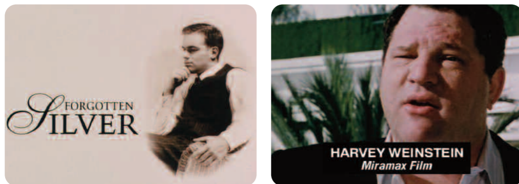
Forgotten Silver , Peter Jackson