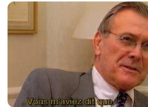
Opération Lune, William Karel

Opération Lune est construit avec trois catégories de témoins : il y a premièrement les interviews détournées avec des personnes bien connues comme Richard Nixon ou Donald Rumsfeld qui viennent des productions documentaires précédentes de Karel sur les présidents américains et leurs conseillers Les Hommes de la Maison-Blanche (1999) et Conversation avec les hommes du Président (2000). Deuxièmement, le texte joué par huit