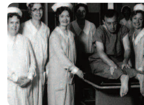
Zelig, Woody Allen