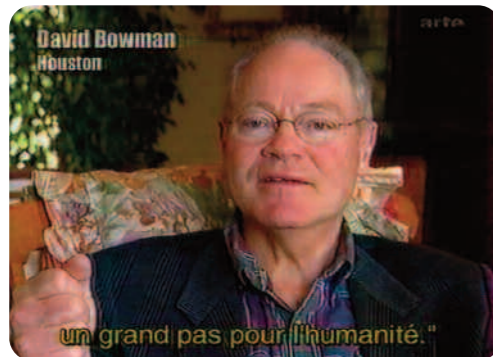
Opération Lune, William Karel

Si les témoins et les images d'archives font autorité, le discours d' Opération Lune devient de plus en plus farfelu : après un quart d'heure consacré à l'explication de l'histoire de la course à la lune, David Bowman, employé de la Nasa à l'époque, raconte les mauvaises blagues que Neil Armstrong aurait fait lors du voyage et ensuite le film nous fait écouter les enregistrements des dialogues des astronautes pendant leur sortie sur la lune. Armstrong s'y plaint des prix de la cantine et parle d'une relation extraconjugale en total décalage avec le moment historique qu'il est en train de vivre. Même le spectateur ignorant que le personnage principal du film de Kubrick 2001: A Space Odyssey (2001 L'odyssée de l'espace , 1968) s'appelle David Bowman comme le témoin dans Opération Lune pourrait se poser des questions par rapport à la véracité des propos 18 .