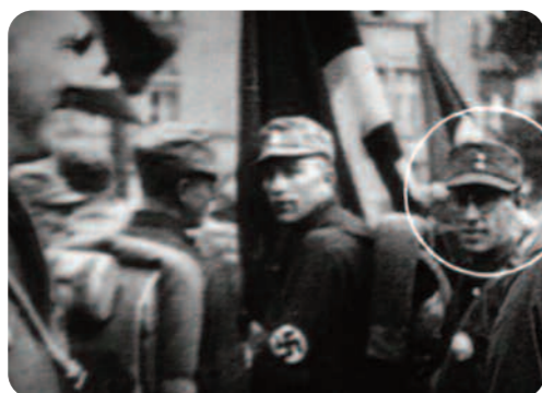
Zelig , Woody Allen