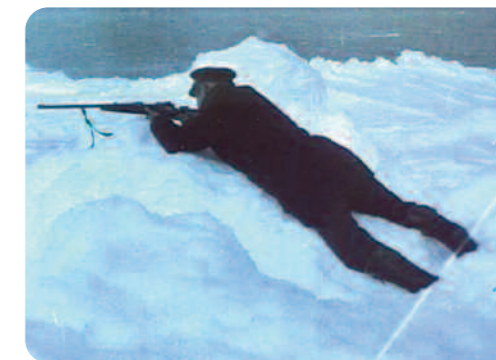
Forbidden Quest , Peter Delpeut

À la fin d'une expédition désastreuse marquée par des meurtres, du cannibalisme et une rédemption mystique, le film nous explique comment le charpentier a pu s'échapper : à travers un passage liant les deux pôles. Le spectateur qui ne s'est douté de rien sait maintenant que même si les images sont d'époque, elles n'ont aucun rapport avec le récit qui est inspiré par des récits fantastiques d'Edgar Allen Poe, Jules Verne et T.S. Eliot.