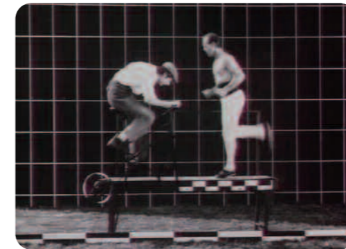
Ce qui me meut, Cédric Klapisch

Mais bien évidemment, tous les documenteurs ne fonctionnent pas de façon identique. Pour pouvoir les classer, deux auteurs américains, Jane Roscoe et Craigh Hight, proposent un modèle qui permet d'évaluer ce qu'ils appellent le mock documentary selon le degré de réflexivité : c'est à dire la façon dont les films rendent leur caractère médiatique explicite et incitent les spectateurs à la réflexion 10 . Leur modèle est décliné par trois degrés : primo , la parodie, qui se moque de formes culturelles comme les mock-rockumentaries ; secundo , la critique, qui s'attaque à des sujets politiques et des pratiques médiatiques; tertio , la déconstruction, qui s'en prend au documentaire même en mettant en question son statut et l'éthique des documentaristes.