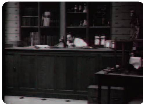
Ce qui me meut, Cédric Klapisch