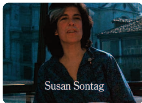
Zelig , Woody Allen

En 1983, Zelig sort sur les écrans. Avec ce film, Woody Allen venait de produire une, si ce n'est pas LA référence de ce qu'on appelle aujourd'hui en France le documenteur et dans le contexte anglo-américain documentary . Zelig présente le cas de Leonard Zelig, l'homme caméléon qui marqua les esprits dans les années 1920 et 1930 en s'adaptant physiquement à son entourage. Le film s'ouvre sur des images d'archives commentées par des intellectuels comme Susan Sontag, Irving Howe et Saul Bellow qui expliquent le phénomène et confirment la véracité des images d'archives à travers lesquelles Zelig retracera l'histoire de son héros éponyme.