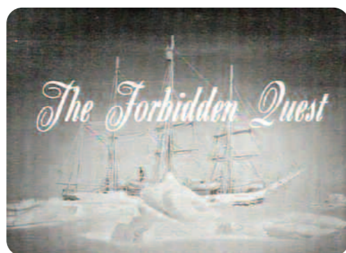
Forbidden Quest , Peter Delpeut

Le générique du début ne dure qu'une minute et vingt secondes, mais en fait il est rempli de signaux contradictoires. Le film est dédié à Frank Hurley (James Francis Hurley, 1885-1962), un aventurier, photographe et cinéaste australien qui a réalisé des images photographiques remarquables, mais qui est aussi très critiqué parce qu'il les a souvent retouchées pour les rendre plus dramatiques en ajoutant par exemple des nuages orageux sur un champ de bataille de la Grande Guerre. Ensuite, le générique nous présente un nom d'acteur, Joseph O'Connor pour continuer avec la promesse de nous raconter l'histoire inconnue d'une expédition accompagnée d'informations factuelles comme les dates exactes et le nom du bateau ainsi que sa photo et la phrase « As told by Ship Carpenter J.C. Sullivan ». Ces éléments documentaires sont perturbés par un carton avec la citation d'une chanson de Lou Reed : « It's so cold in Alaska ». Où est le rapport entre le pôle nord évoqué par Lou Reed avec une expédition en Antarctique, c'est-à-dire au Pôle Sud si ce n'est que le fait qu'il y fait froid ? Donc, dès le début la stratégie du réalisateur est de situer son film entre les pôles du documentaire et de la fiction avec une référence à la culture pop qui promet aussi un film divertissant.