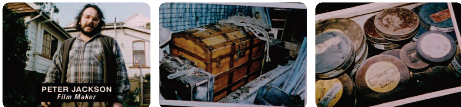
Forgotten Silver , Peter Jackson

Au début du film, Peter Jackson se met en scène avec la malle dans laquelle se trouvent les pellicules découvertes, mise en scène qui fonctionne comme la preuve de l'authenticité de leur contenu.