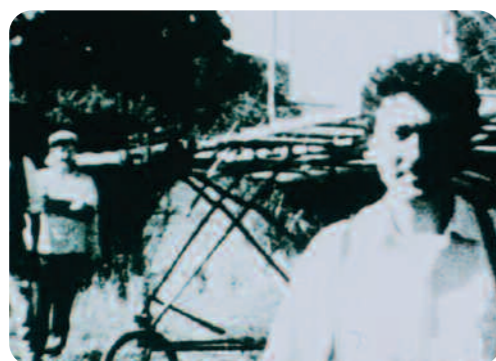
Forgotten Silver , Peter Jackson

Les découvertes « scientifiques » sont un mélange entre vraies et fausses informations comme dans Ce qui me meurt , et servent dans Forgotten Silver à structurer le film et à faire avancer le récit. On apprend que Colin McKenzie a inventé le travelling, le film parlant, le film en couleur, qu'il a même réalisé un gigantesque péplum dans la jungle néo-zélandaise et qu'il a documenté avec sa caméra des événements d'importance nationale comme le premier envol d'un aéroplane avant le vol des frères Wright.