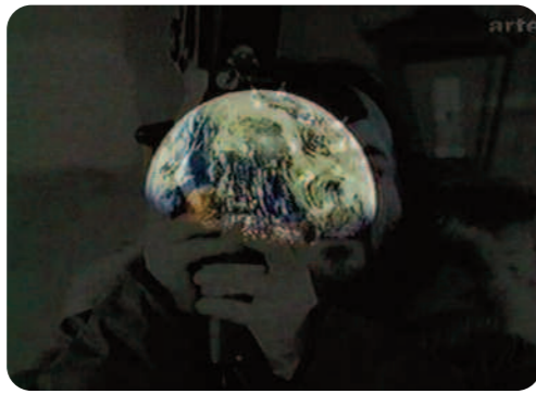
Opération Lune, William Karel

Si les témoins et les images d'archives font autorité, le discours d' Opération Lune devient de plus en plus farfelu : après un quart d'heure consacré à l'explication de l'histoire de la course à la lune, David Bowman, employé de la Nasa à l'époque, raconte les mauvaises blagues que Neil Armstrong aurait fait lors du voyage et ensuite le film nous fait écouter les enregistrements des dialogues des astronautes pendant leur sortie sur la lune. Armstrong s'y plaint des prix de la cantine et parle d'une relation extraconjugale en total décalage avec le moment historique qu'il est en train de vivre. Même le spectateur ignorant que le personnage principal du film de Kubrick 2001: A Space Odyssey (2001 L'odyssée de l'espace , 1968) s'appelle David Bowman comme le témoin dans Opération Lune pourrait se poser des questions par rapport à la véracité des propos 18 .