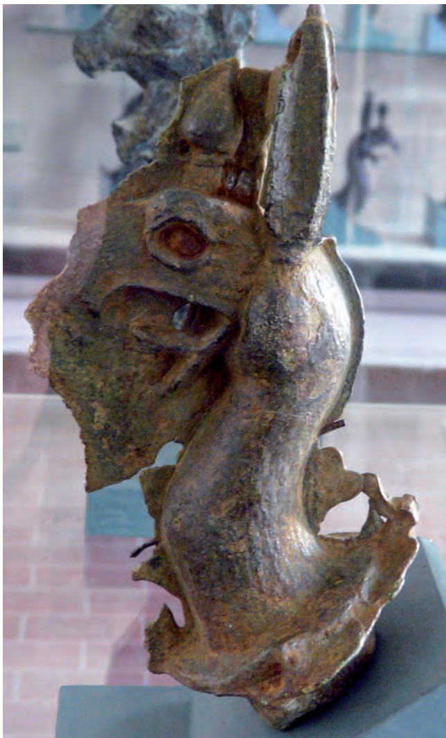
Figure 8. Protome de griffon de Samos, raté de coulée (B 1284).

Les deux sculpteurs samiens sont associés comme ingénieur et architecte à l'Héraion de Samos, à la fin du VII e siècle, voire dans la première moitié du siècle d'après Pline. Ils auraient appris en Égypte les méthodes de fonte en creux, qui permettent de fabriquer des statues à partir des parties assemblées 51 . L'emprunt à l'Égypte ne tient pas seulement au prestige de ce pays dans l'imaginaire grec, mais à des relations étroites entre Samos et le monde pharaonique 52 , qui se traduisent dans la première moitié du VI e siècle par une « égyptomanie ambiante » 53 .