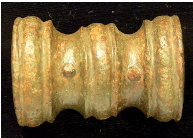
Figure 2. Attache d'anse en bobine, Delphes 23838.