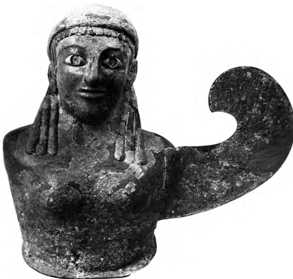
Figure 12. Buste ailé de divinité, sphryrelaton , Olympie, Br. 6500.

est originale : cet être ailé n'est pas courant dans les représentations archaïques et l'identification avec une déesse reste une hypothèse ; on serait tenté d'y voir un autre lien entre innovation artistique et espace sacré. En tout cas, c'est un témoignage important de la grande statuariaire de bronze de fabrication ionienne.