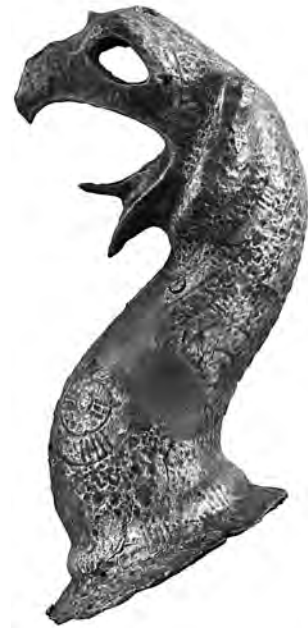
Figure 9. Protome de griffon inv. 2620.

Des documents comme cette statuette suggèrent que les informations transmises par les auteurs antiques peuvent trouver un écho dans le matériel : les bronziers samiens n'ont pas inventé la fonte en creux, mais ont développé de nouvelles techniques de coulée de petits et de grands bronzes avec une très haute maîtrise. Deux autres statuettes samiennes permettent de comprendre cette phase de riches expériences : la statuette du joueur d' aulos (fig. 10), conservée aujourd'hui à Athènes 64 , est une fonte pleine, exceptionnelle pour une statuette de grande taille (42 cm). Cette réussite technique montre la permanence de différents procédés dans les ateliers samiens. Enfin, un kouros porteur d'offrande (fig. 11), conservé à Berlin 65 , présente des particularités techniques qui ont été étudiées, en l'occurrence l'utilisation d'un négatif comme aide à la réalisation de la statuette. P. Bol en a montré le processus de fabrication : la radiographie (rayons X) de l'œuvre fait clairement apparaître une ligne droite le long du corps, qui sépare l'avant et l'arrière en deux morceaux d'épaisseur très différente. On a donc pris sur un modèle un moule en creux, puis on a fait