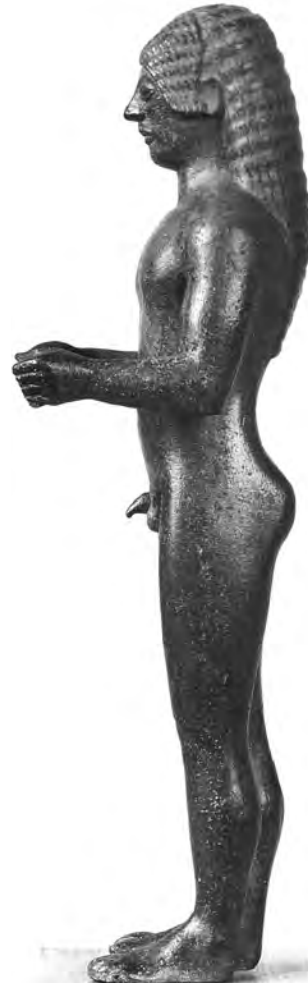
Figure 11. Kouros porteur d'offrande, Berlin 31098.