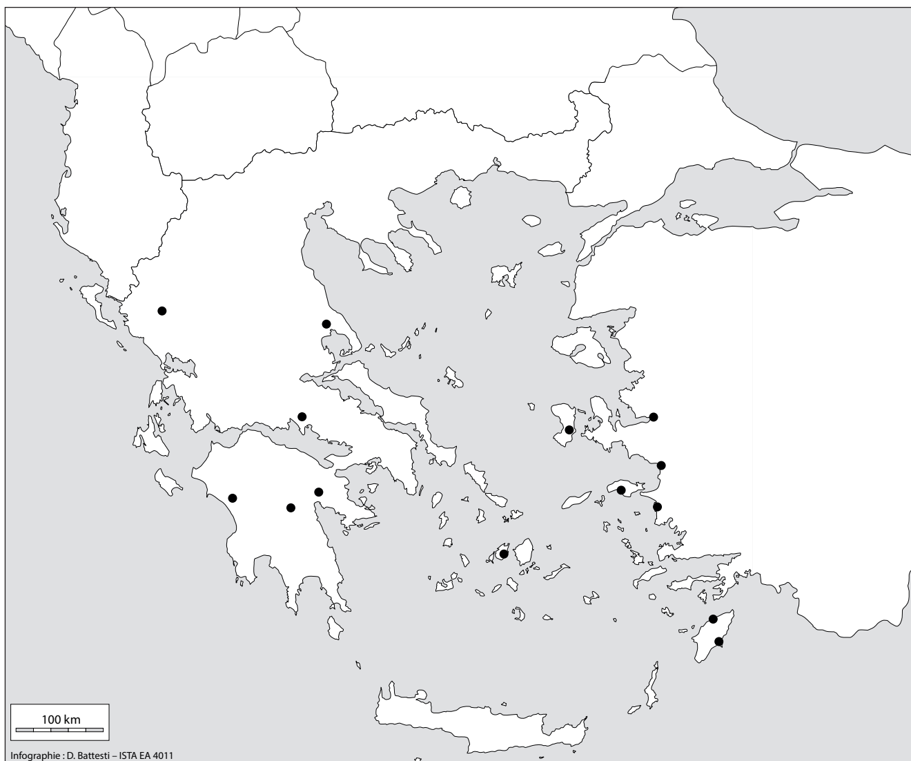
Figure 5. Distribution des objets phrygiens dans les sanctuaires grecs.

sûrement à Samos que les objets phrygiens sont les plus nombreux 26 . Si la céramique de Grèce de l'Est est bien représentée à Samos, les bronzes ioniens sont plus difficiles à différencier de la parure phrygienne qui ne peut être dénombrée exactement à cette époque.