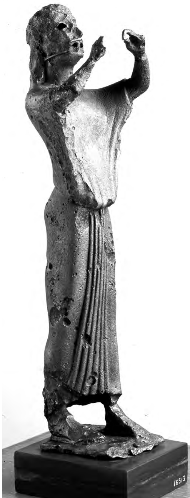
Figure 10. Joueur d' aulos , Athènes, musée national 16513.

deux valves qui se rejoignent sur les flancs. Dans chaque valve, on a mis une couche de cire et l'espace central est rempli de terre qui joue le rôle de noyau. L'utilisation de ces moules en négatif avait été suggérée dès 1979 par U. Gehrig ; or, la découverte en 1984 dans l'Héraion d'un kouros absolument identique, portant la dédicace d'un certain Smikros, permet de préciser certains aspects des techniques employées par les artisans samiens. Les deux statuette ont exactement les mêmes dimensions ; elles n'ont pas été copiées l'une sur l'autre, mais supposent l'existence d'un prototype qui a été moulé pour obtenir ces deux figures 66 . Ce phénomène de duplication est documenté par deux autres figurines de cavalier 67 , avec néanmoins de légères différences dans les jambes et les bras qui laissent penser que les têtes, les corps et les membres peuvent mélanger différents modèles. Quoiqu'il en soit, les procédés, dont on peut suivre la trace à travers ces documents, requièrent beaucoup d'expérience et de savoir-faire, qui sont la marque des ateliers samiens au VI e siècle av. J.-C. 68 . Les découvertes de l'Héraion assurent enfin que les bronziers travaillaient à proximité immédiate ou à l'intérieur du sanctuaire, en étroite relation avec l'espace sacré 69 .