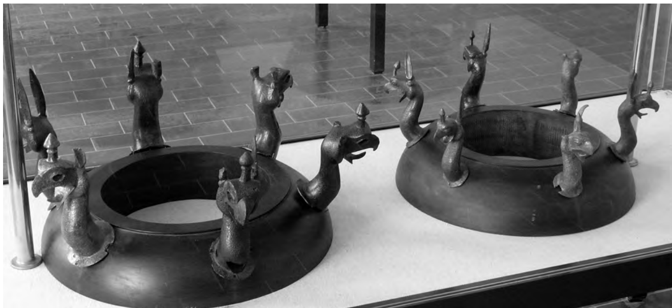
Figure 6. Chaudron à protomes de griffon, musée de Samos.

Pérachora 31 et d'Argos 32 , au sanctuaire d'Athéna à Tégée 33 , et à l'Altis à Olympie 34 ; enfin, plus au nord, les sanctuaires d'Apollon et d'Athéna à Delphes, le sanctuaire de Zeus à Dodone 35 , et celui d'Artémis à Phères 36 ont livré des bronzes « phrygiens ».