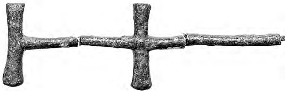
Figure 3. Attache d'anse de phiale, Delphes 23770.

Des nombreux éléments de vaisselle trouvés dans les sanctuaires relèvent de la toreutique d'inspiration phrygienne. Les coupes de type phrygien, bien connues grâce aux découvertes des tombes de Gordion 10 , ont été offertes dans les sanctuaires et ont laissé des fragments caractéristiques. Les « bobines » de bronze ou des tiges de section semi-circulaire formant des anses (fig. 2 et fig. 3) proviennent de coupes peu profondes, sur le bord desquelles elles étaient maintenues par deux rivets. On en trouve à Delphes, à Olympie 11 , à l'Héraion d'Argos 12 , à Pérachora 13 , à Éphèse 14 .