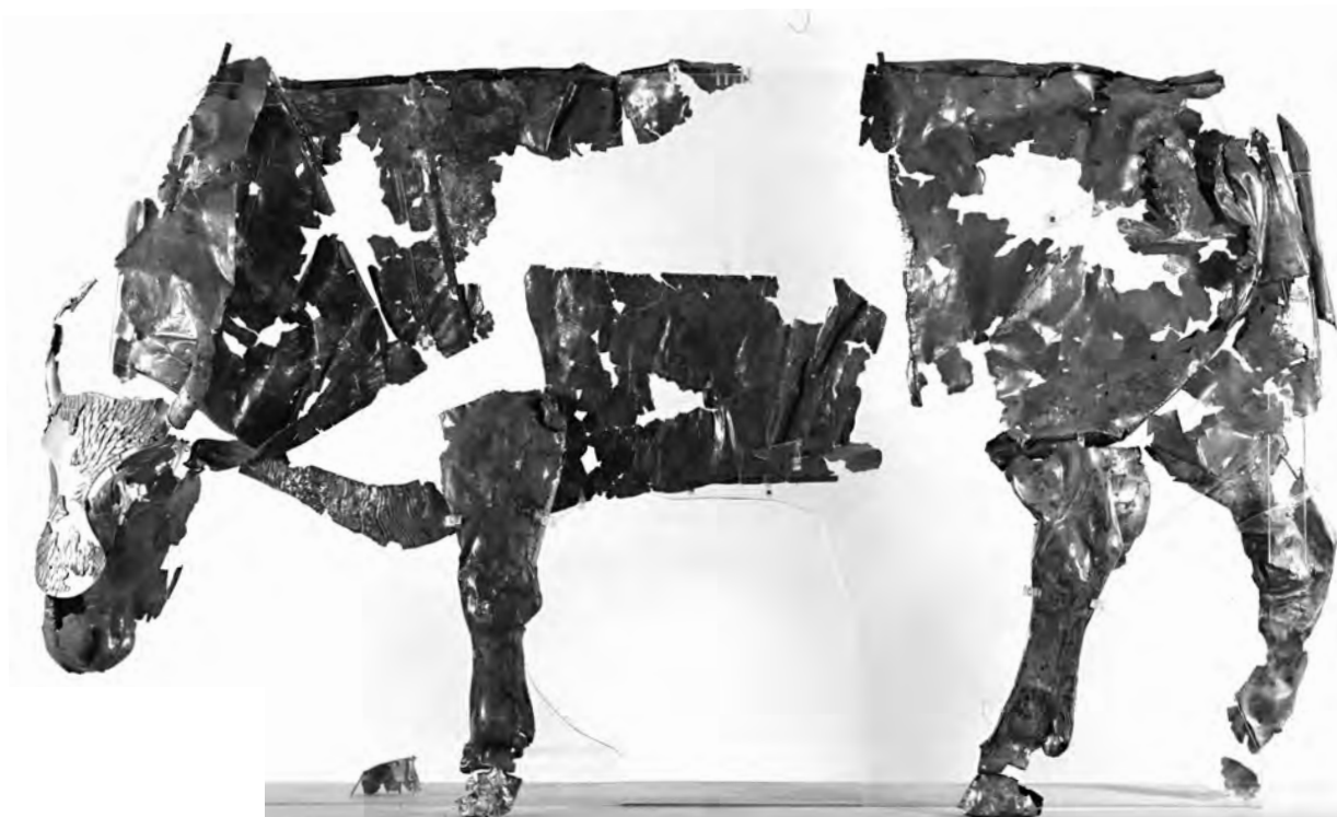
Figure 13. Taureau en argent de Delphes, sphyrrelaton .