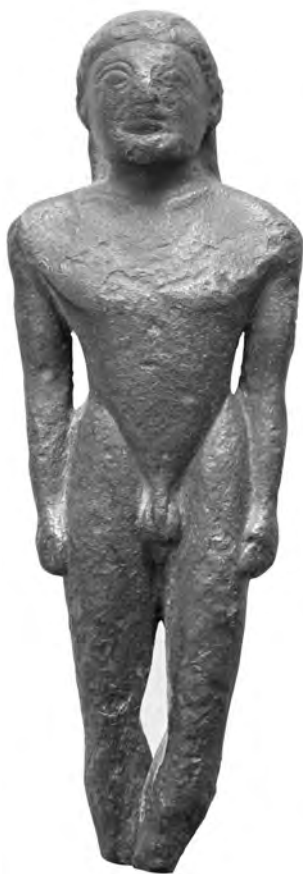
Figure 14. Kouros en bronze, Delphes 2846.

Le taureau en argent découvert à Delphes dans les fosses de l'Aire par P. Amandry (fig. 13) fait aussi partie de la série des sphyrrelata ioniens qui continuent à être produits tout au long du VI e siècle 75 . Malgré son état de conservation qui ne permet pas beaucoup de comparaisons stylistiques, il est considéré comme une production d'une cité d'Ionie, peut-être un peu avant le milieu du VI e siècle. La technique du sphyrrelaton , dans ce cas, utilise une âme de bois comme support au métal martelé ; les plaques d'argent, plus d'une soixantaine, sont clouées sur des bandes de cuivre argentées 76 et étaient séparées de la structure en bois par une mince couche d'un matériau malléable, argile ou cire 77 . Ce chef-d'œuvre de la toreutique ionienne apparaît dans un contexte où la création plastique, au VI e siècle, est « imprégnée d'ionisme » 78 . Ainsi, on ne s'étonne pas de trouver des statuette dans un style de Grèce de l'Est, comme le montre un kouros en bronze (fig. 14). Le modelé de cette statuette masculine nue (H. 15,3 cm), assez sommaire et brutal 79 , mais mou, la rattache à la Grèce de l'Est, avec encore le schéma du corps en V, les épaules bien plus larges que le bassin. Elle est généralement datée avant le milieu du VI e siècle. D'après E. Langlotz, c'est même une œuvre typique du style de Milet : les volumes sont composés par plans, et non par courbes (comme à Samos) ; elle atteste quoi qu'il en soit la diffusion des bronzes d'Asie Mineure en contexte religieux.