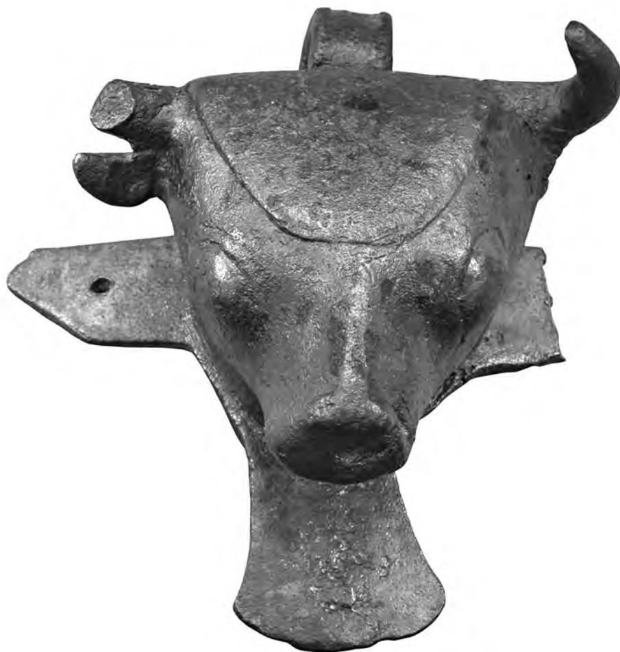
Figure 4. Tête de taureau, Delphes 2351.

(fig. 4) présente un modelé schématisé, des yeux bombés, une plaque lisse sur le front qui la rapproche d'exemples de Gordion 18 . Une autre applique, inédite et moins bien conservée 19 , présente aussi un modelé, mais surtout un décor gravé typique des documents phrygiens.