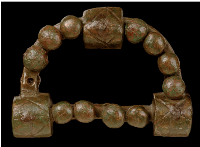
Figure 1. Boucle de ceinture, Delphes 4363

Les plus anciens bronzes d'Asie Mineure connus dans les sanctuaires grecs sont des objets phrygiens, ou dont le type se rapproche des productions phrygiennes. La parure est très bien représentée, par des « fibules » de type phrygien, avec un arc en demi-cercle et de grosses moulures 3 , ou des boucles de ceinture, retrouvées bien plus nombreuses dans les sanctuaires grecs. Elles présentent le même élément en arc, avec un décor de moulures, souvent plus chargé sur les exemplaires grecs que sur les exemplaires phrygiens. C'est surtout la technique, en l'occurrence l'utilisation de clous à grosse tête ronde, qui signale les objets comme phrygiens ou dans la tradition phrygienne. Si le type est désigné comme phrygien, en fait il semble que ses origines soient égéennes, avec des variantes en Ionie ou en Phrygie 4 ; quoi qu'il en soit, ce type se diffuse largement en Asie Mineure et dans le monde grec 5 . Les ceintures en bronze de même structure, avec des arcs plus ornés, sont particulièrement anciennes et nombreuses dans les sanctuaires d'Ionie, à Chios 6 , Samos, Éphèse 7 , Érythrées, Didymes et Smyrne 8 . Mais ces objets de parure sont parvenus dans des sanctuaires au-delà de l'Ionie, à Olympie et à Delphes 9 (fig. 1).