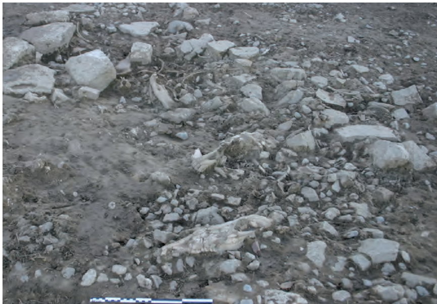
Fig. 7. Dépôt ou épandage d'ossements d'équidés sur le site de Pech Maho (Aude, France) : on remarque l'absence de connexions, l'éparpillement des restes, ainsi que l'excellente conservation des côtes.

Enfin, diverses observations archéologiques et taphonomiques soulignent le caractère secondaire de ces dépôts en partie remaniés par des réaménagements de l'espace à la