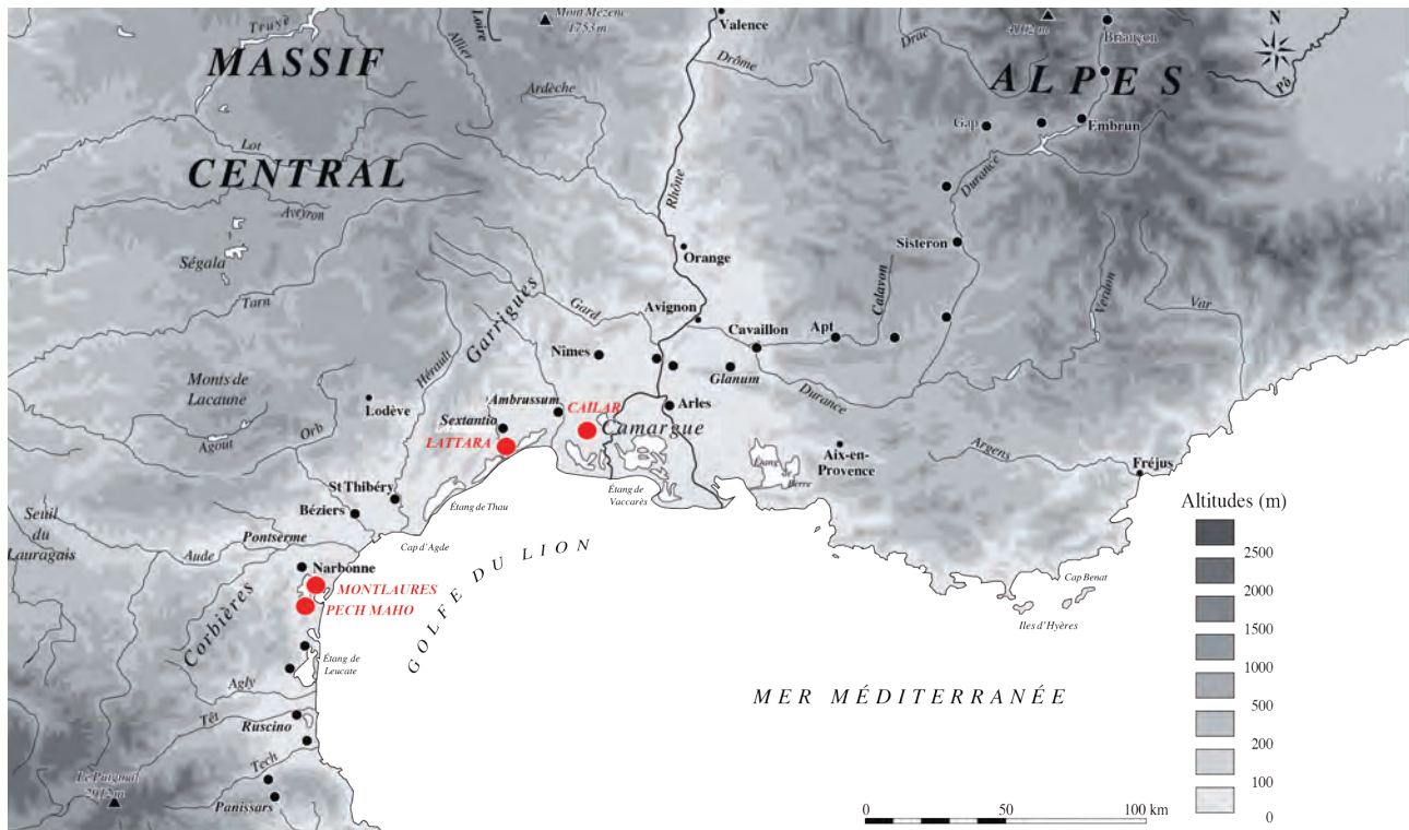
Fig. 1. Carte de la France méridionale et localisation des sites archéologiques mentionnés.

terminer l'origine de l'assemblage, sa signification, et afin de statuer sur la faisabilité ou non de l'étude en fonction de problématiques posées en amont, au niveau archéo-historique.