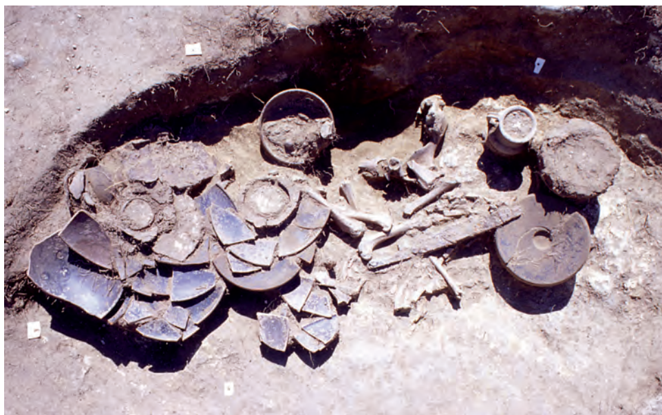
Fig. 11. Tombe à incinération d'Ensérune SP1001 (Hérault, France) : on distingue les dépôts de faune au milieu des offrandes (céramiques, urne, armes). Les ossements sont individualisés et on ne trouve pas de connexion anatomique in situ.