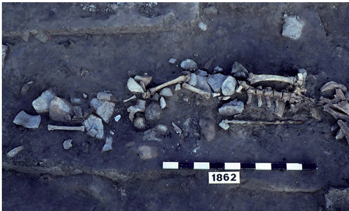
Fig. 3. Le dépôt DP50004 (Lattes, Hérault, France) in situ : on devine l'alignement contre un mur, les os complets ainsi que les portions encore en connexion anatomique et la broche à rôtir.

pôts osseux mêlée à celle d'autres mobiliers (broches à rôtir par exemple), indique une décharge unique recouverte rapidement par un remblai. Seul un fragment osseux porte des traces de mâchonnage par un chien, ce qui revient à environ un taux de 1,2% de restes rognés. En revanche, le pourcentage d'os porteurs de marques de rognage passe à 11,5% dans les couches de remblais sous- et sus-jacents ... cela confirme, avec l'organisation des dépôts et la conservation des ossements dont le volume initial a été préservé, la mise en place et le recouvrement rapide de la structure dans son ensemble. On a dans un premier temps parlé de « dépôt de boucherie », car il s'agissait de désigner un assemblage provenant d'activités spécialisées résultant d'un fait ponctuel caractérisé par un assemblage original dans le sens où le contexte archéologique et la nature des vestiges diffèrent des assemblages ordinaires en contexte domestique (déchets de consommation épars et fragmentés incluant de nombreuses pièces squelettiques et souvent plusieurs espèces animales).