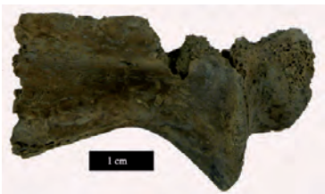
Fig. 5. Détail de l'axis du jeune cabri identifié dans l'assemblage faunique du dépôt DP75059 à Pech Maho (Aude, France) : on distingue nettement les deux impacts de découpe liés à la séparation tête-corps au niveau de la deuxième vertèbre cervicale (ici en vue ventrale).

sation, en relation peut-être avec la découpe progressive de la carcasse : en premier lieu le crâne et les côtes désolidarisées et mêlées, puis les portions de membres par os, déposés en fagot, et enfin les vertèbres. Le critère de choix de l'animal, de son âge, est-il culturel ? Relève-t-il uniquement de la disponibilité à un moment donné d'un chevreau ? En l'absence d'autres témoins archéologiques, peut-on parler de « rituel », dans la mesure où ces procédés ne semblent reproduits nulle part ailleurs ? Faut-il en fin de compte « classer » cet événement dans une pratique rituelle, à caractère religieux, ou bien dans une pratique à domestique à caractère funéraire ?