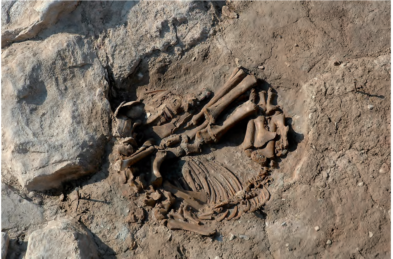
Fig. 12. Inhumation du fœtus de cheval (FEEQ 9) à l'intérieur de l'habitat, au pied d'un mur : forteresse de Els Vilars (Arbeca, Catalogne, Espagne). On observe l'adaptation à la fosse aménagée et les connexions anatomiques visibles.

cifique suffisant pour ajouter à la liste des animaux habituellement inhumés les ânes et les mules. Ajoutons que quelques chiens ont également été trouvés à Amphipolis. Il est intéressant de constater que les représentations anatomiques des différents équidés d'Amphipolis sont du même ordre que celles des chevaux évacués dans le puits de Lattara, ou encore celle du cheval mort abandonné au coin d'une rue de la même ville. Mais ils se différencient très nettement des assemblages d'équidés de Pech Maho par les connexions observées in situ à l'échelle de squelettes entiers, par l'absence de dispersion des os, par l'absence également de marques de découpe ou encore de l'action du feu.