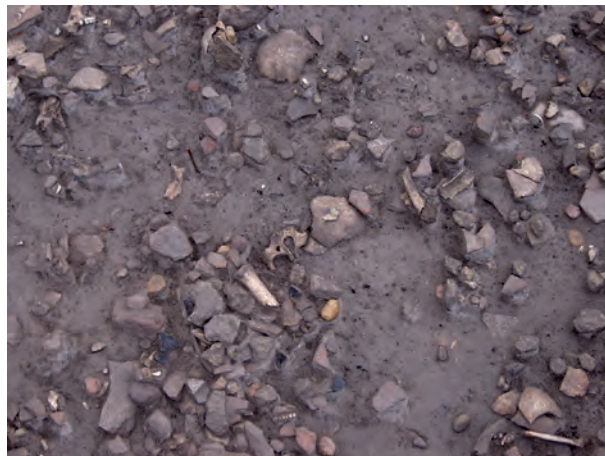
Fig. 8. Vue de la fouille correspondant au dépôt de crânes et d'armes du Cailar (Gard, France). Les os sont fragmentés et disséminés au milieu des restes humains, des tessons de céramique, des pierres, et des petits galets.

Le caractère « guerrier » du dépôt avec ses trophées de têtes humaines découpées mêlées à de l'armement pose la question de la présence, voire du sacrifice, des cavaliers avec leurs montures à l'issue d'un combat. Rien cependant ne distingue l'assemblage des équidés de ceux des autres espèces domestiques consommées. La consommation du cheval étant une pratique attestée à l'âge du Fer, il est normal d'en retrouver des éléments fragmentés, découpés et dispersés en provenance de déchets culinaires. Si des chevaux ou des portions de chevaux (des têtes par exemple) avaient été associés au dépôt initial (crânes humains et trophées), l'assemblage osseux correspondant se distinguerait de celui des autres mammifères (conservation de portions particulières, état de fragmentation différent) : on aurait été confronté à un assemblage de type « spécifique » différent de celui des reliefs de repas habituels, ce qui n'est pas le cas.