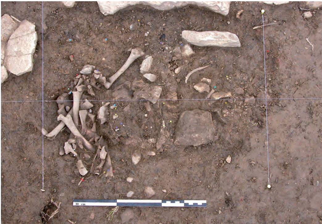
Fig. 4. Fouille du dépôt DP75059 (Pech Maho, Aude, France). Les différents ossements du jeune cabri apparaissent progressivement au fur et à mesure des décapages, et on devine l'effet « fagot » dû à un processus de mise en place os par os.

les os longs des membres antérieurs et postérieurs, et enfin les vertèbres. Ces dernières, du fait de l'âge de l'animal, étaient fragmentées et éparpillées mais des remontages ont permis de constater que tout le rachis était présent. Le squelette humain identifié à un stade périnatal était déposé par-dessus. L'analyse des ossements en laboratoire a montré que l'animal, entier, avait été préalablement mis en pièce par découpe après éviscération, et probablement sans avoir été consommé. C'est ici toute la question de l'offrande animale, au sens où on a l'habitude de la nommer, et de son association avec un autre squelette (ici un bébé nouveau-né). En effet, la détermination précise de l'animal permet de décrire le phénomène, sans pour autant lui trouver une interprétation pertinente en l'absence de données littéraires : un petit cabri non destiné à la consommation a été sacrifié à l'occasion de l'inhumation d'un enfant mort en bas âge. Sa carcasse a été éviscérée puis dépecée. La tête a été coupée au niveau de la deuxième vertèbre cervicale (Fig. 5), le rachis a été tronçonné et décharné, les membres découpés de manière à isoler chaque segment. Le squelette complet a été déposé portion par portion au fond d'une fosse et le nourrisson a été placé par-dessus. L'ordre de mise en place ne semble pas aléatoire, bien au contraire, puisque la succession des gestes identifiés suppose une organi-