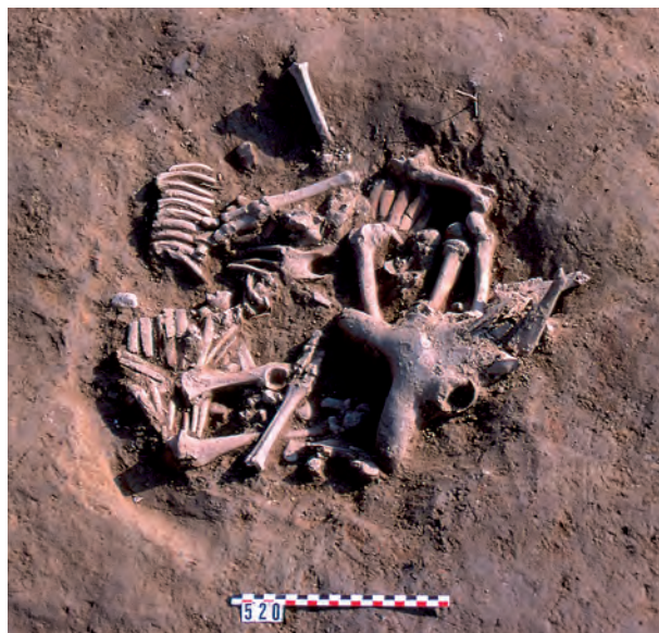
Fig. 6. Vue de la fouille de l'un des dépôts (SQ289) correspondant à une brebis mise en pièce et désossée dans une fosse aménagée à l'intérieur d'une cour : site de Montlaurès (Aude, France). On aperçoit les grils costaux en place et les extrémités de membres en connexion anatomique.

Le deuxième exemple de dépôt animal provient du site de Montlaurès, près de Narbonne en France méridionale. 8 Trois dépôts en fosses contenant chacun un squelette complet d'ovin ( Ovis aries ) ont été fouillés dans un secteur appartenant à un contexte domestique de la seconde moitié du IV e siècle av. n. è. 9 Les têtes étaient complètes et en connexion avec les mandibules déposées sur le dessus, ainsi que les extrémités des pattes (à partir des articulations carpiennes et tarsiennes) et les grils costaux. Les os longs étaient déposés os par os, en « fagot », et le rachis vertébral désolidarisé. Les trois individus ont été identifiés de la manière suivante : deux femelles de 24 et 48 mois environ (SQ286 et SQ288), et un jeune adulte (SQ289) entre 9 et 20 mois (Fig. 6). Dans les trois cas, les marques de découpe témoignent d'un dépeçage poussé des carcasses, visant à isoler les éléments par organe (chaque segment des membres est individualisé) ou en portions (tête, bas de pattes, plats de côtes). On observe donc à Montlaurès une forte analogie avec le dépôt précédemment décrit à Pech Maho : zone géographique (Aude, France), synchronie (IV e s. av. n. è.), animal ( Ovis , Capra ), squelettes complets, mise en pièce poussée des carcasses, déposition en fosse selon une organisation spécifique en relation probable