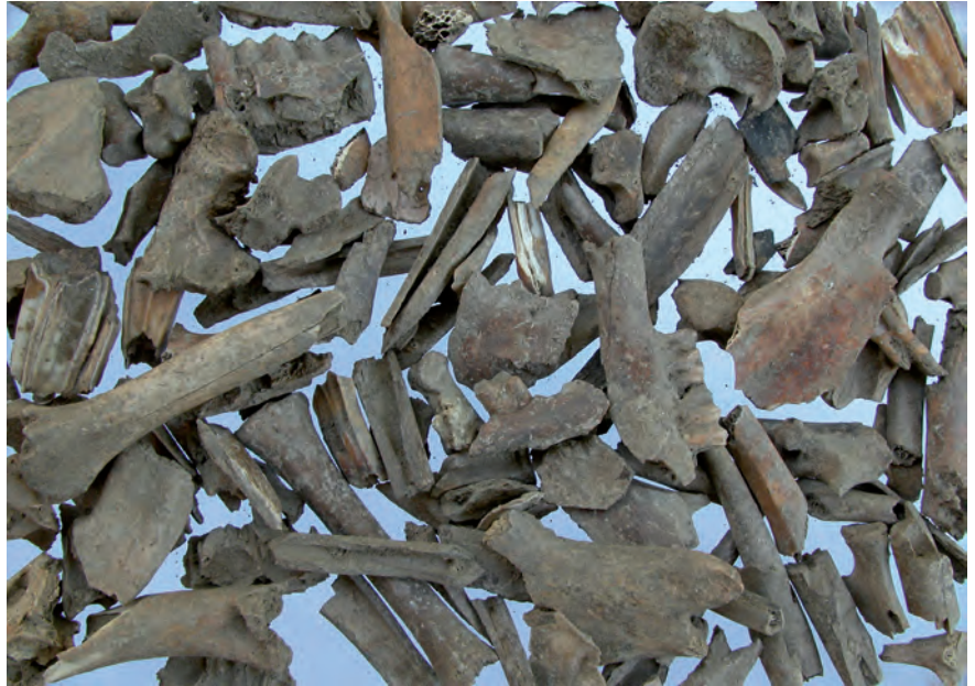
Fig. 2. Un assemblage faunique, tel qu'il arrive sur la table de l'archéozoologue.