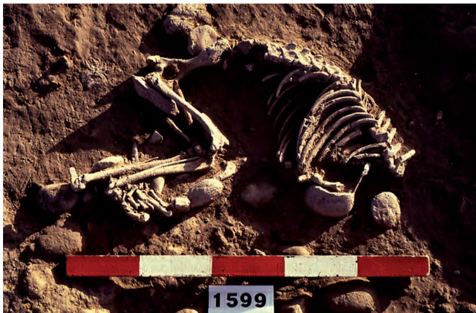
Fig. 9. Squelette de chien abandonné dans une rue de la cité antique de Lattes (Hérault, France). Pas de fosse visible mais l'inhumation volontaire n'en est pas pour autant exclue, même si aucun mobilier n'accompagne le squelette en connexion anatomique stricte.

D'autres contextes permettent de repérer des zones de litières ou de fumier grâce aux études d'organisations sédimentaires. 26 Ces indices, avec les trouvailles effectives de coprolithes associées aux ossements rognés soulignent de manière concrète la présence d'animaux vivants, en particulier de chiens, dont certains squelettes complets et en connexion anatomique ont été retrouvés dans les rues antiques ( Fig. 9 ). Toutefois, s'il est permis d'évoquer des chiens divaguant autour des maisons, les témoins de la présence effective d'espèces telles que les chevaux et les bœufs sont très rares. Sans doute faut-il envisager que ces derniers ne séjournaient pas dans la ville mais y étaient introduits pour les besoins des transports de marchandises ou pour être abattus (bien que cette étape n'ait jamais été attestée par les études archéozoologiques). Les fouilles récentes de la zone 1 (secteur 55) de la ville nous permettent de lever le voile sur cette question depuis la découverte d'une aire de circulation d'animaux identifiée grâce à des empreintes de sabots imprimés dans un sédiment organique