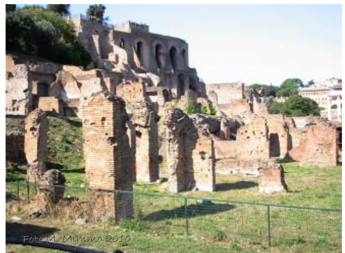
Fig. 6 - Strutture oggi visibili nella parte meridionale dell'edificio. A sinistra della foto si nota l'importante interro che occupa questo settore, permettendo la fruizione delle strutture in alto, a livello della Nova via.