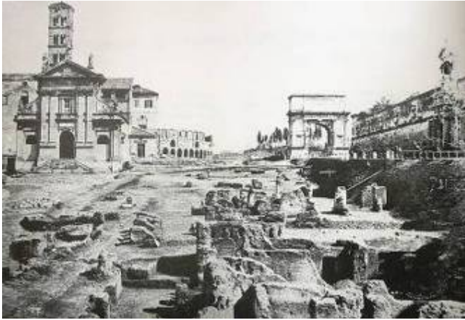
Fig. 3 - Strutture degli horrea Vespasiani messe in luce da R. Lanciani prima dell'abbattimento del muro di cinta degli Orti Farnesiani (visibile in alto a destra). (Immagine tratta da Tomei BA 1995).

dell'anno 354 a.C., portò ad identificare i resti con gli horrea Vespasiani . Le parole del Chronographus aumentano il loro valore se si considera che effettivamente di fronte agli horrea Vespasiani si trovano tutt'oggi i resti degli horrea Piperataria , costruiti dall'imperatore Domiziano secondo quanto espresso dalla fonte e oblitterati dalla Basilica di Massenzio 3 .