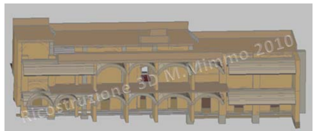
Fig. 8 (sotto) - Sezione E-W della parte meridionale dell'edificio.

L'impianto delle fondazioni corrispose alla soluzione della problematica scelta del sito, in cui fu necessario gestire una doppia pendenza: quella della pendice palatina (degradante da sud verso nord) e quella verso il Foro, da est verso ovest. I costruttori impostarono abilmente fondazioni e piani pavimentali su diversi livelli degradanti nel senso delle due pendenze: commistionando le esigenze statiche a quelle di percorrenza risulta che la serie di gradoni vennero disposti in corrispondenza dei vani esterni e che lo spazio centrale probabilmente fu mantenuto su di un unico livello, permettendo un eventuale transito carrabile. La difficoltà di gestire staticamente l'edificio è dimostrata anche dall'inserimento sistematico di archi di scarico a livello fondale. Essi sono puntualmente collocati in corrispondenza di archi di scarico inseriti nei muri d'alzato, a loro volta calibrati in corrispondenza di un pilastro a blocchi di travertino. I pochi resti di pavimento suggeriscono l'utilizzo dell' opus spicatum nei vani e l'utilizzo di lastre di travertino negli spazi di maggiore percorrenza.