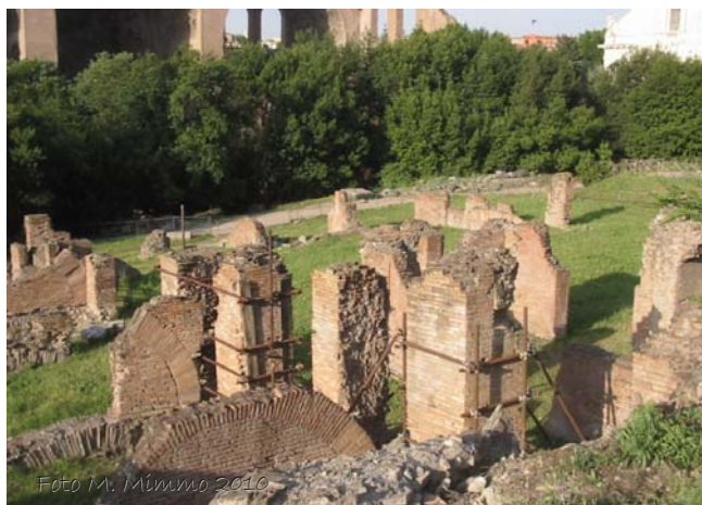
Fig. 9 - Strutture del settore occidentale viste da sud verso nord.

Gli alzati conservati sono tutti realizzati in opus caementitium con rivestimento laterizio, sul quale non è stata rinvenuta purtroppo alcuna traccia di intonaco o altro rivestimento finale. In alcuni punti è riscontrabile l'utilizzo di una tecnica laterizia più tarda, databile all'età severiana.