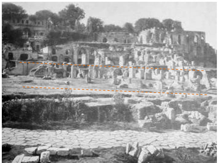
Fig. 2 – Pendice settentrionale del Palatino, con le strutture residue degli horrea Vespasiani riprese da nord verso sud. (Immagine tratta da Lugli 1970, Itinerario di Roma antica ). In primo piano il livello pavimentale della Sacra via d'età repubblicana; in tratteggio il livello approssimativo raggiunto in età imperiale dalla Sacra via e la quota della Nova via. Il dislivello tra le due strade si aggira intorno ai cinque metri.

Fino al 1883, prima dell'abbattimento del muro di cinta degli Orti Farnesiani, erano visibili solo i resti fronte-strada dell'edificio, strutture che ben si prestavano a coincidere con i negozietti di perle e preziosi dei margaritarii , e che dunque R. Lanciani interpretò come appartenenti alla Porticus Margaritaria . Da una parte dunque, per molto tempo, si interpretarono i resti di quelle strutture come Porticus Margaritaria , soprattutto sulla base delle iscrizioni dei margaritarii de Sacra via , dall'altro lato invece, la maggiore considerazione di quanto espresso nel Chronographus