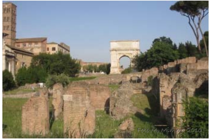
Fig. 4 - Strutture degli horrea Vespasiani oggi visibili, dopo l'abbattimento del muro degli Orti Farnesiani, le cui strutture, innestandosi direttamente sugli horrea danneggiarono in maniera pesante l'edificio.

Degli horrea Vespasiani sono attualmente visibili proprio quelle parti di edificio che vennero messe in luce nel secolo scorso. Esse corrispondono ad una serie di strutture murarie, tutte apparentemente disarticolate tra loro, con porzioni di muri che nella maggior parte dei casi non si estendono per più di qualche metro in lunghezza e solo in una parte dell'edificio si conservano in altezza per alcuni metri. Le vicende traumatiche che investirono questa parte della pendice palatina non hanno permesso la conservazione né dei sistemi di copertura, né dei piani pavimentali.