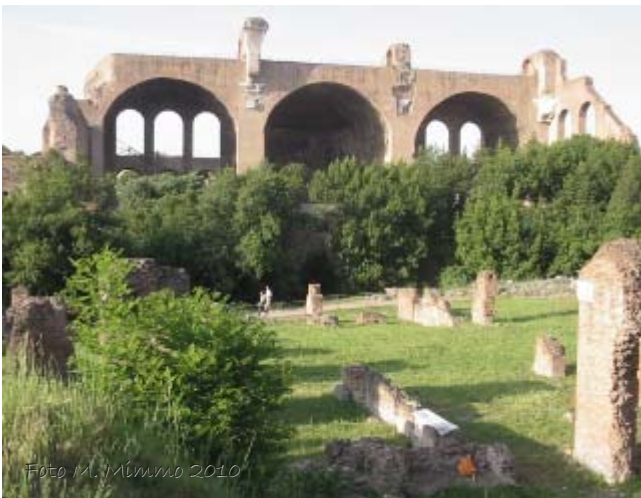
Fig. 5 - Strutture oggi visibili dell'edificio, posizionato esattamente di fronte alla Basilica di Massenzio al di sotto della quale si trovano i Piperataria . Vista da sud verso nord dello spazio corrispondente alla corte centrale e delle strutture verso la Sacra via.

Degli horrea Vespasiani sono attualmente visibili proprio quelle parti di edificio che vennero messe in luce nel secolo scorso. Esse corrispondono ad una serie di strutture murarie, tutte apparentemente disarticolate tra loro, con porzioni di muri che nella maggior parte dei casi non si estendono per più di qualche metro in lunghezza e solo in una parte dell'edificio si conservano in altezza per alcuni metri. Le vicende traumatiche che investirono questa parte della pendice palatina non hanno permesso la conservazione né dei sistemi di copertura, né dei piani pavimentali.