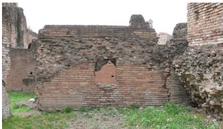
Fig. 11 - Resti di volta a botte in un vano del settore meridionale dell'edificio.

I sistemi di copertura sono poco conservati, ma è riscontrabile che la soluzione preferenziale di copertura dei vani fosse la volta a botte, di cui rimangono alcuni chiari indicatori. In alcuni casi si identificano dei restauri nei sistemi di copertura databili all'età traianea - adrianea.