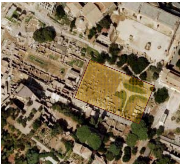
Fig. 1 – Evidenziata l'area degli horrea Vespasiani , collocati tra la Sacra via e la Nova via, di fronte agli horrea Piperataria (obliterati dalla Basilica di Massenzio, a nord). Ad ovest è visibile la Casa delle Vestali..

Collocati lungo la pendice settentrionale del Palatino, gli horrea Vespasiani si trovano attualmente all'interno del sito archeologico Palatino-Foro Romano, in un'area quadrangolare compresa tra la Casa delle Vestali ed il cd clivo Palatino, direttamente affacciati sui due importanti percorsi viari della Sacra via a nord e della Nova via a sud 1 . Nonostante la posizione privilegiata lungo la Sacra via, dagli inizi delle ricerche nel XIX secolo, si perpetuò un tiepido interesse per quelle strutture laterizie che emergevano lungo il lato meridionale del percorso viario, mentre le indagini si rivolgevano con fresco vigore ai resti della strada, in un susseguirsi di interventi che videro tra i promotori Lanciani e a seguire Boni, coinvolgendo i pareri di molti altri 2 .