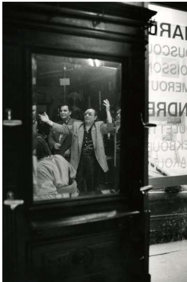
Photo 3 - Ambiance un dimanche dans un café du quartier de Belleville, Paris, France