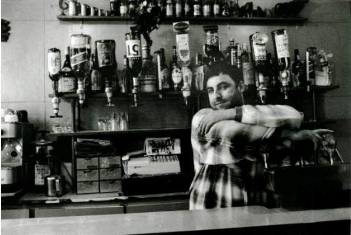
Photo 2 - Patron d'un café du quartier de Belleville, Paris, France