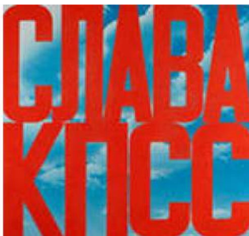
Illustr. 2. – Gloire au PCUS !