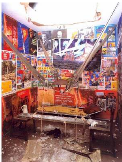
Illustr. 1. – L'homme qui s'est envolé dans l'espace depuis son appartement

multiplier ces projets. Il y est accueilli chaleureusement, comme l'inventeur du genre de l'installation totale.