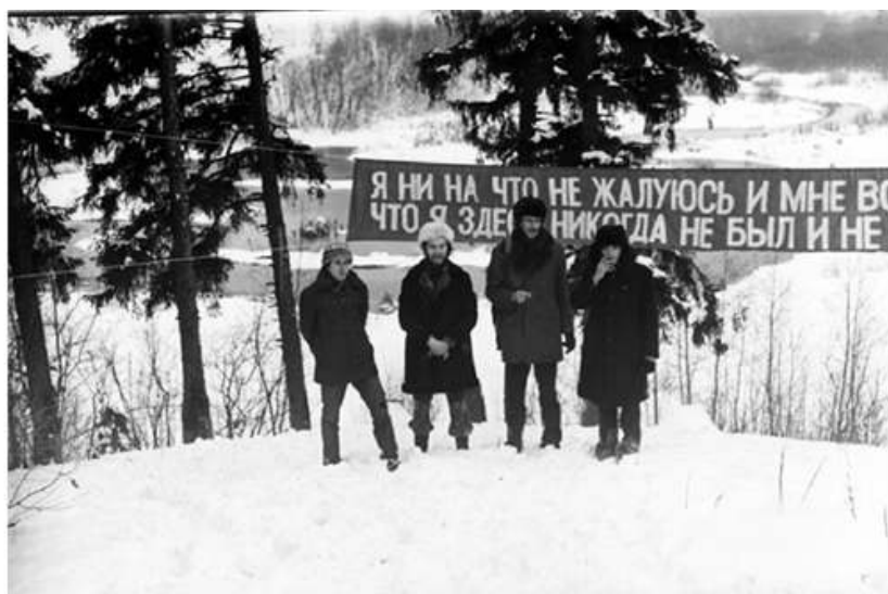
Illustr. 3. – Une action du groupe Actions collectives