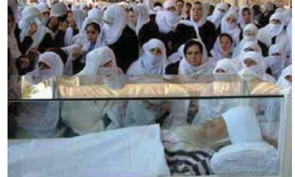
Fig. 2 - Les femmes en pleurs devant la dépouille du cheikh Amin Tarif.

Minorité issue d'un schisme de l'Islam ismaélien et organisée en communauté dans le sud du Liban au XI e siècle, les druzes ont la particularité d'avoir développé une religion secrète, influencée à la fois par la mystique musulmane et la philosophie aristotélicienne. La notion de cycle qui organise la cosmogonie druze (cycle des prophéties et des manifestations divines) a trouvé une expression originale dans la conception de la réincarnation de l'âme de corps en corps. Tout à fait singulière en milieu musulman, cette croyance est tout de même encadrée par des déterminismes sociologiques forts (on se réincarne selon son genre et selon sa religion) qui garantissent la permanence de la communauté.