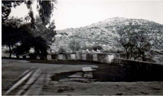
Fig. 1 - Le cimetière druze de Maghar en Galilée. La banquette en pierre, au centre de l'esplanade, permet le dépôt du cercueil pour un dernier hommage au mort. Le cercueil est ensuite déposé dans le caveau familial, sans spécification de nom. Les cimetières druzes ne sont jamais visités.

Il s'agit, en fait, d'atteindre la perfection de l'âme au terme d'une multiplicité de vies vécues en tant que druze . La perfection visée est un état de dépassement total de son individualité (c'est-à-dire ses désirs, sa volonté, sa capacité d'agir dans le monde), seul à même de permettre l'anéantissement en Dieu. Ceux qui atteignent cet état sont les religieux parfaits et sortent du cycle des réincarnations. Jamais plus de quelques-uns par « époque », ils représentent l'idéal religieux qui permet à l'ensemble communautaire de se définir.