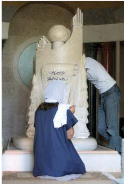
Fig. 4 - La tombe du cheikh Abou Hassan Arif Halawi, chef spirituel des druzes du Liban, décédé en 2003. À la différence des tombeaux des prophètes, elle est accessible et les visiteurs ont un rapport très charnel : ils la caressent, l'embrassent, l'enserrent dans leurs bras.