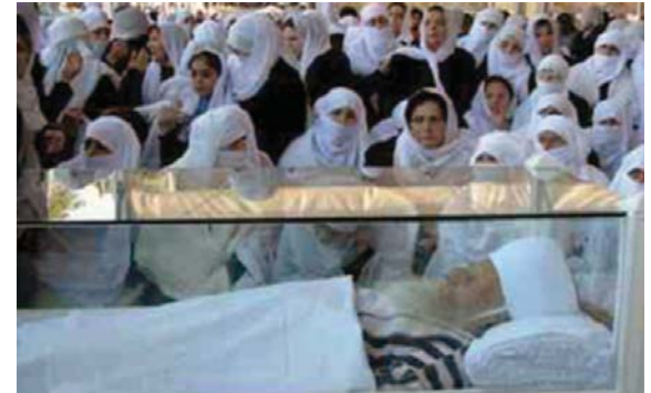
Fig. 2 - Les femmes en pleurs devant la dépouille du cheikh Amin Tarif.

Proches en cela des conceptions musulmanes relatives au traitement des morts, les druzes investissent considérablement les pratiques rituelles précédant l'inhumation, mais ne se préoccupent absolument pas de la dépouille après l'enterrement. Dans certaines régions druzes, la logique du corps comme vêtement de l'âme dont on doit se débarrasser après la mort conduit à l'anonymat total des cimetières sans plaques ni cénotaphes (fig. 1). « L'enjeu » des funérailles consiste, en réalité, à garantir la bonne réincarnation de l'âme du défunt. C'est là l'affaire des femmes qui restent assemblées autour du cercueil pendant la (les) nuit(s) qui précède(nt) la mise en terre et qui chantent des lamentations et des poésies religieuses. Les hommes viennent ensuite « arracher » le corps des mains des femmes pour le conduire en cortège jusqu'au cimetière où les religieux prononceront les formules pieuses d'usage scellant la respectabilité de l'âme en tant que druze. À ce moment, le corps peut disparaître.