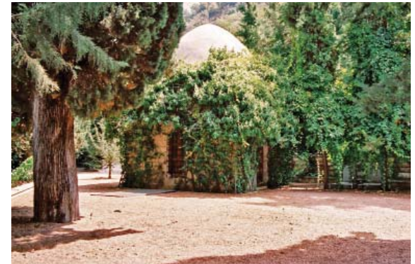
Fig. 6 - La tombe du « seigneur de la montagne libanaise », dans l'enceinte du palais familial à Mukhtara. Kamal Joumblatt, assassiné en mars 1977, est la figure par excellence du martyr druze, englobant, par métonymie, tous les combattants de la guerre civile.