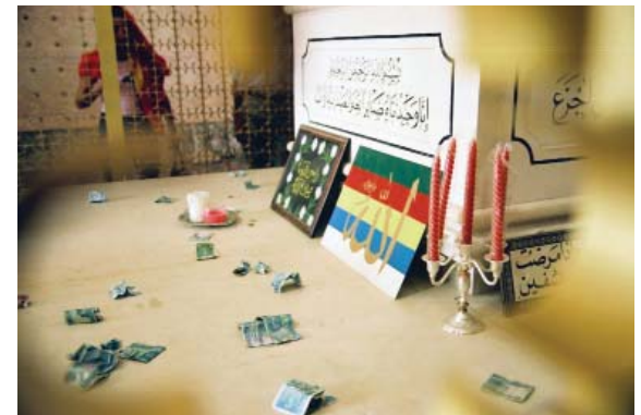
Fig. 3 - Le tombeau du prophète Ayoub (Job) à Niha, au Liban. Ce cénotaphe arbore le drapeau druze à cinq bandes de couleur.