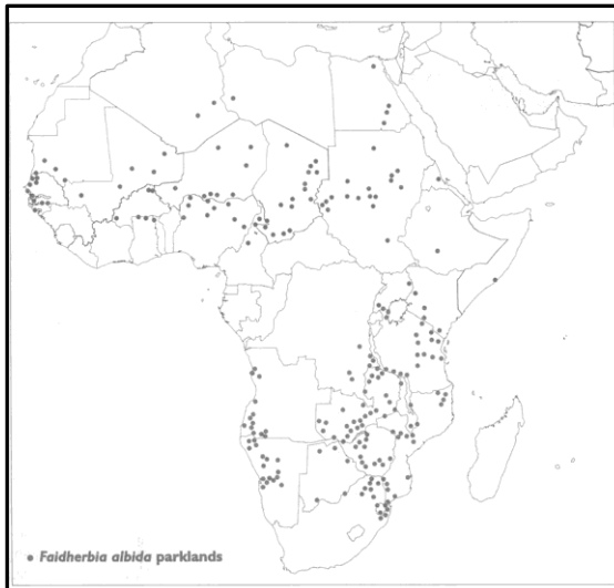
Figure 1. Aire de répartition des parcs à Faidherbia

Pour illustrer ce propos, nous allons prendre l'exemple des parcs à faidherbia au Nord-Cameroun. Mais cette réflexion a une portée plus générale, compte tenu de l'aire de répartition des parcs à faidherbia. (Figure 1, d'après (Boffa, 1999))