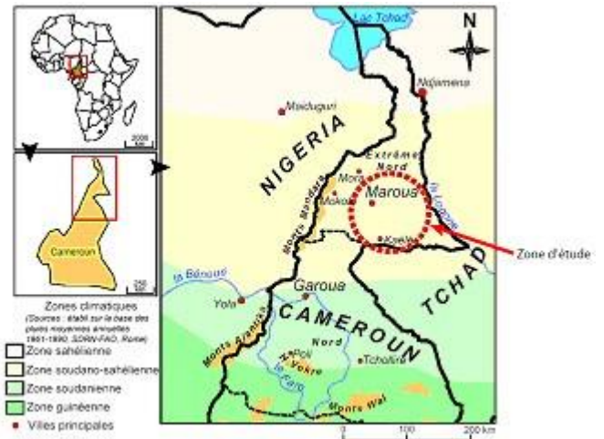
Figure 2. Localisation de la zone d'étude

(Bernard, 1999). Mais, dans tous les cas, l'espèce d'arbre n'était conservée que si son association avec les cultures était favorable ou peu gênante. Par exemple, le Faidherbia albida , qui perd son feuillage en saison des pluies, peut être associé à plusieurs cultures qui se développent pendant cette saison, telles que les sorghos à cycle court, mais pas avec les sorghos à cycle long ou à cycle inversé, qui fructifient pendant que l'arbre a repris son feuillage et ombrage les cultures.