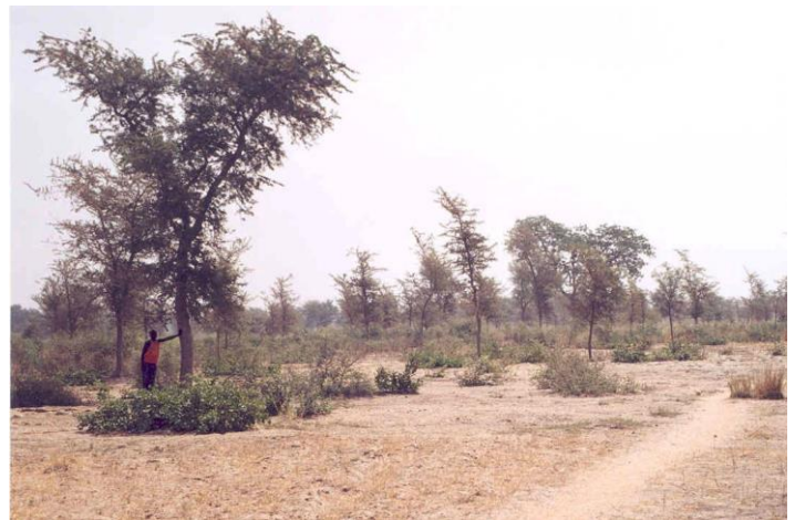
Figure 3. Champs de brousse où les faidherbias adultes sont absents

La dynamique d'extension spatiale du parc arboré à faidherbia est donc avérée. Elle est le résultat d'une volonté délibérée des paysans Tupuri aidés par un projet, à la recherche des avantages agronomiques (augmentation de la production) et économiques (fourniture de fourrage et de bois de feu) que procure le faidherbia par sa présence au milieu des cultures pluviales. Cette volonté s'est matérialisée par la mise en œuvre de pratiques de sélection et de taille des jeunes plants du faidherbia issus de la régénération naturelle, régénération facilitée par la présence du bétail qui favorise la diffusion des semences sur le territoire du village.