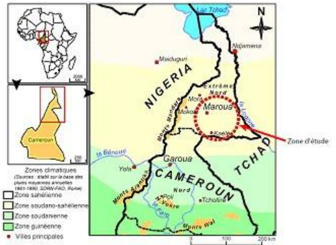
Figure 2. Localisation de la zone d'étude

(Bernard, 1999). Mais, dans tous les cas, l'espèce d'arbre n'était conservée que si son association avec les cultures était favorable ou peu gênante. Par exemple, le Faidherbia albida , qui perd son feuillage en saison des pluies, peut être associé à plusieurs cultures qui se développent pendant cette saison, telles que les sorghos à cycle court, mais pas avec les sorghos à cycle long ou à cycle inversé, qui fructifient pendant que l'arbre a repris son feuillage et ombrage les cultures.