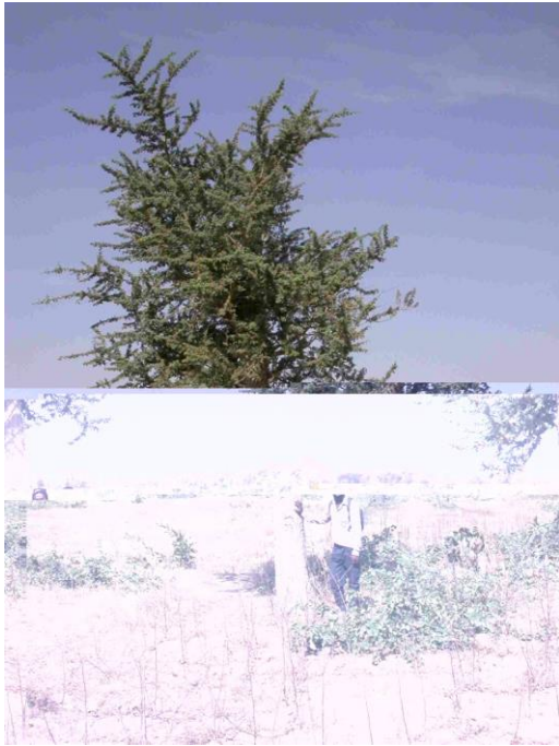
Figure 4. Exemple d'un cas d'émondage complet du faidherbia

effet, en zone soudano-sahélienne, le faidherbia se reproduit aussi bien par graines que par drageons et rejets de souche (Centre Technique Forestier Tropical, 1988). C'est la volonté du paysan de développer un jeune peuplement dans son champ qui est alors déterminante : les jeunes faidherbias doivent être sélectionnés et, ayant un port buissonnant, il doivent être éduqués par des tailles successives. La question est alors de savoir si les primes données par le projet seront encore nécessaires. L'intérêt porté par les paysans au développement du faidherbia et la légitimation, de sa présence dans les champs par le système de développement prégnant du coton (la SODECOTON) et de son exploitation par l'Administration forestière, seront-ils suffisants pour entretenir cette dynamique ? Il a été constaté ponctuellement une augmentation du nombre de faidherbias, et ce sans intervention de projet, mais l'on peut se demander quelle pourrait être l'ampleur de ce phénomène 15 .