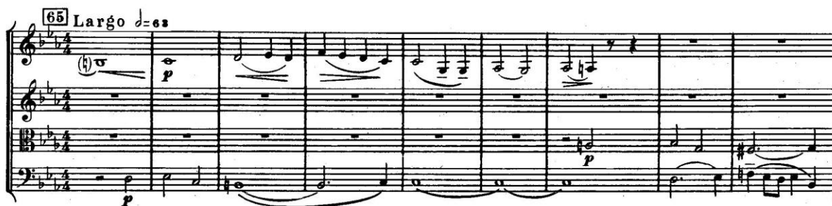
Fig. 6. 8 e Quatuor. 5 e mouvement, début

Signature musicale, autocitations et citations se côtoient donc dans cette œuvre qui donne à entendre, sous couvert d'une dédicace officielle « à la mémoire des victimes du fascisme et de la guerre », une autobiographie musicale. Chostakovitch revient encore, sous la plume de Volkov, sur cette compréhension secrète de la visée du quatuor :