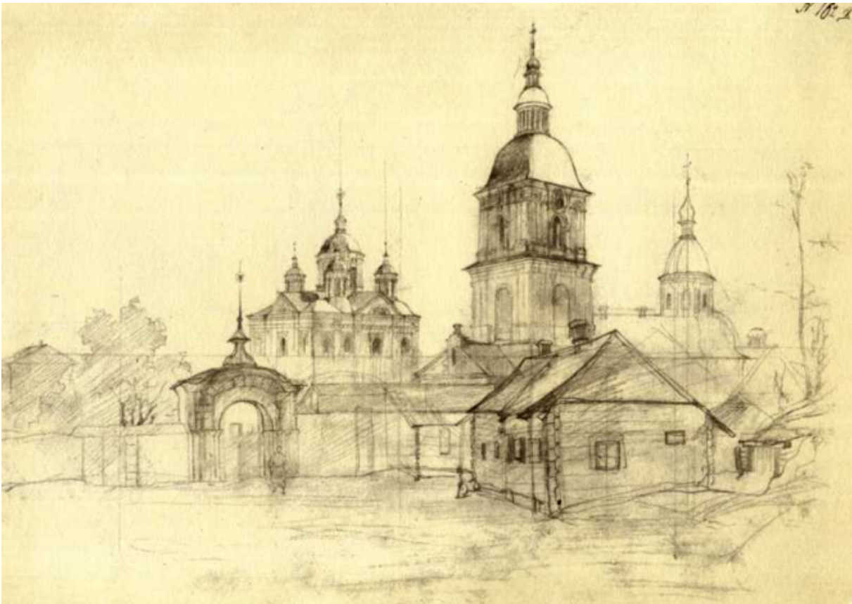
Fig. 6. Le monastère de la Transfiguration du Saint Sauveur de Mežyhirja. Dessin au crayon à mine graffite. 1843.

L'œuvre picturale, graphique et littéraire de T. Ševčenko s'est nourri de thème de l'histoire de la cosaquerie 20 . La contribution de T. Ševčenko-peintre dans la création des ressources iconographiques, qui mettent en valeur le patrimoine architectural ukrainien de la période d'épanouissement de la culture ukrainienne, est très significative et symbolique. L'artiste fut peut-être un des premiers à comprendre et à apprécier profondément l'importance de ces monuments et de voir dans leur diversité une certaine unité, une empreinte commune, c'est-à-dire une tradition architecturale ukrainienne, capable à affirmer l'identité culturelle de la nation.