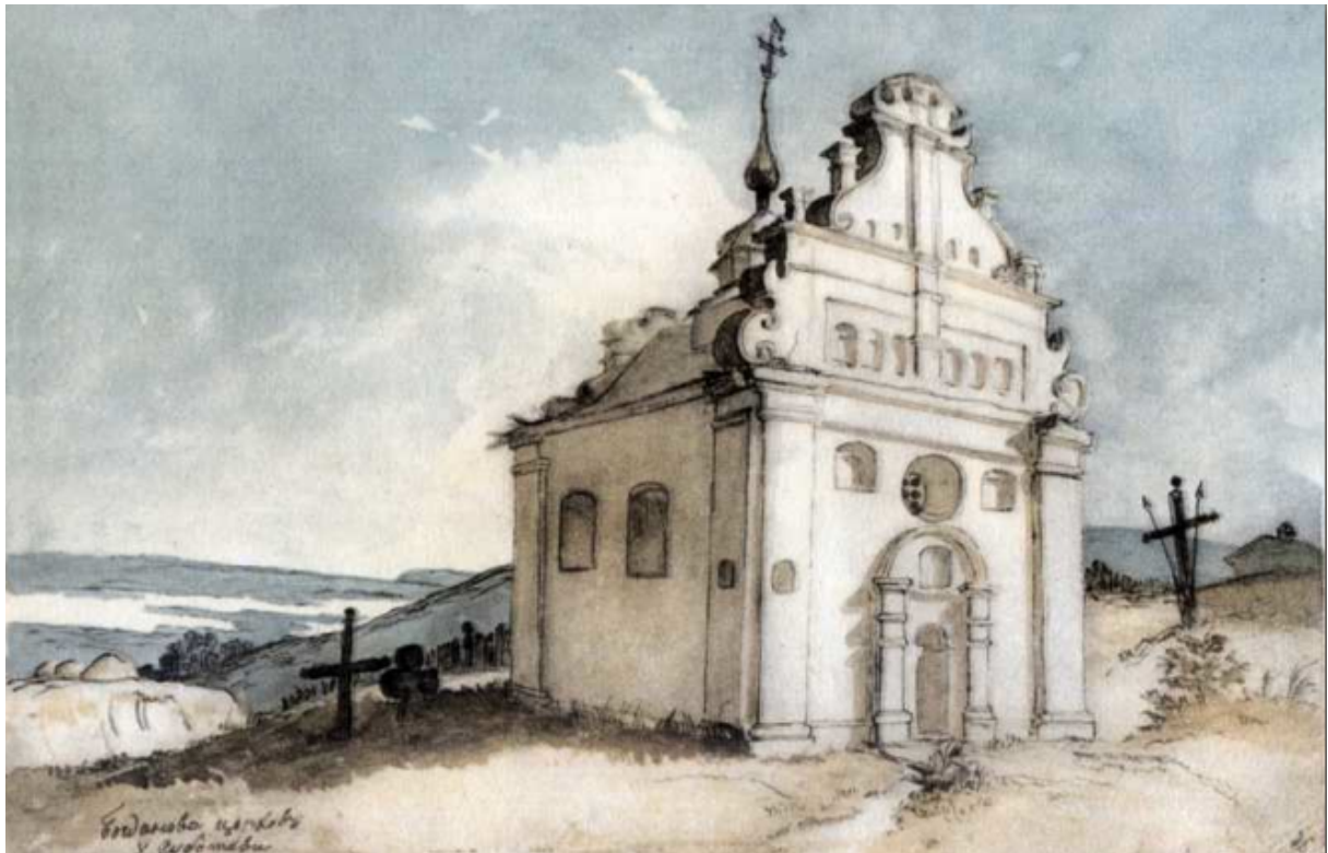
Fig. 5. L'église de Bohdan à Subotiv. Dessin rehaussé à l'aquarelle. 1845.

Dans son poème Les Hajdamaks on assiste à la prise de conscience de T. Ševčenko de l'ampleur de désastre qui s'est abattu sur l'Ukraine depuis la perte progressive de son indépendance. Il exprime sa tristesse et son émotion douloureuse à la vue des restes de l'ancienne capitale des hetmans ukrainiens, Čyhyryn :