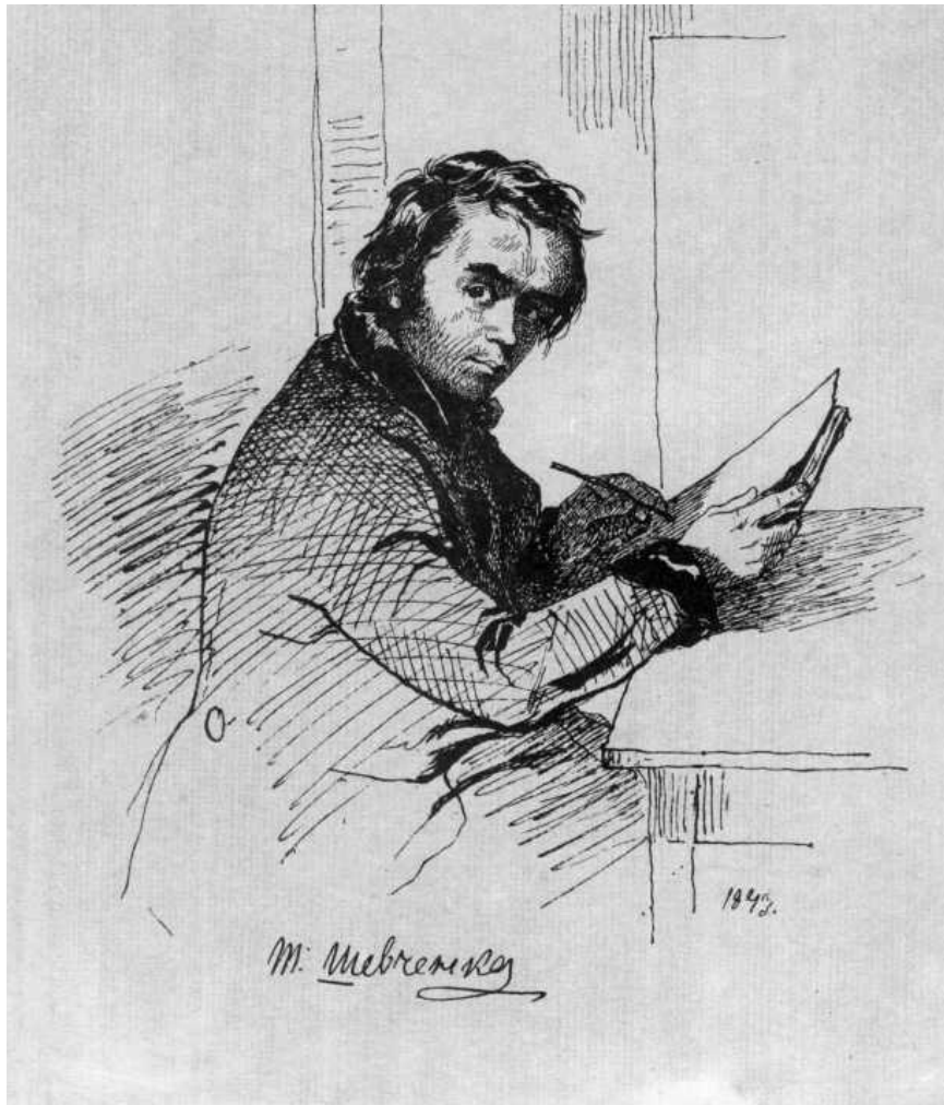
Fig. 1. Autoportrait de T. Ševčenko qui date de son premier voyage en Ukraine de 1843.

L'artiste s'attache à fixer sur le papier les glorieux sites historiques, les silhouettes inimitables des monastères et des églises, les ruines romantiques des châteaux, les petites chapelles abandonnées, les maisons paysannes aux murs blanchis à la chaux recouvertes de chaume.