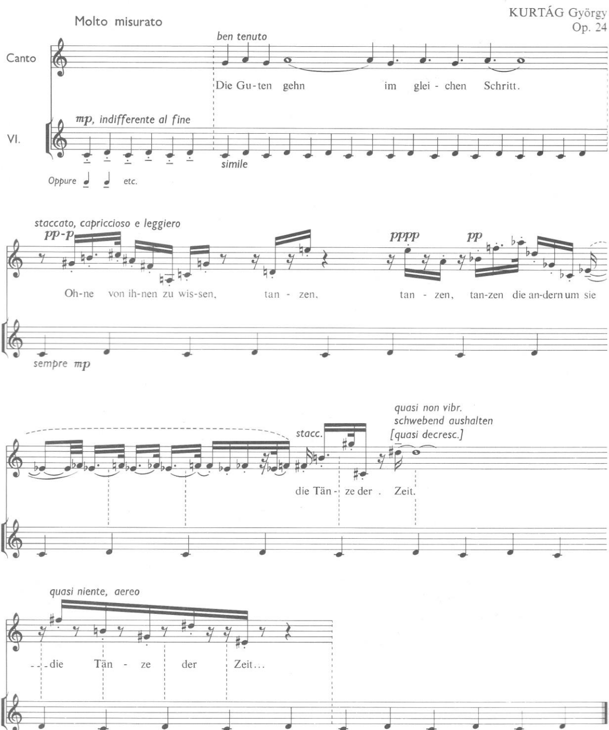
Fig. 6 – Fragments de Kafka op. 24, I, 1