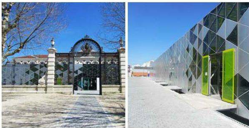
Figure 1. Entrée de la Cité du Design et platine.