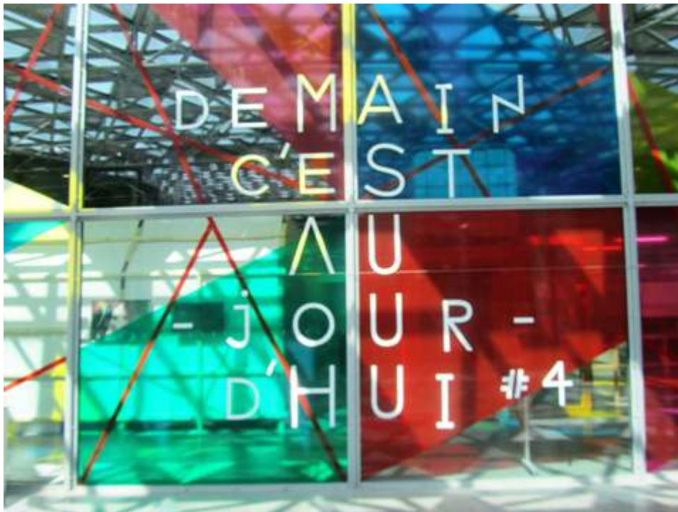
Figure 4. Entrée de l'exposition pour les Biennales 2013.

d'avantage, s'ouvrant à un public plus large et surtout se déplaçant du Palais des Congrès à la Cité du Design. Le nombre de visiteurs a augmenté chaque fois d'environ 20 000 personnes. Si 1998 a vu se déplacer une moyenne de 30 000 visiteurs, celle de 2013, qui a également bénéficié d'un changement de date pour des considérations d'optimisation météorologique, en a accueilli 100 000 à Saint-Etienne 19 . En outre, la taille de l'exposition mais aussi la provenance des exposants a grandement évolué depuis les débuts de l'événement. Il convient également de souligner que la part de visiteurs stéphanois est assez importante – en effet un tiers des visiteurs de l'édition 2013 venait du département de la Loire –, ce qui montre un certain attachement non seulement à l'équipement culturel mais aussi à l'événement. La résonance locale est assez forte puisqu'un autre tiers venait de la région Rhône-Alpes hors département de la Loire, mais la diffusion de l'événement commence à porter ses fruits puisque le tiers restant concerne les visiteurs nationaux et internationaux. Il est important de noter que les Biennales ont depuis leur création eu une dimension internationale car elles permettaient également de créer des liens forts avec les écoles de design situées à l'étranger, notamment avec celle de Montréal.