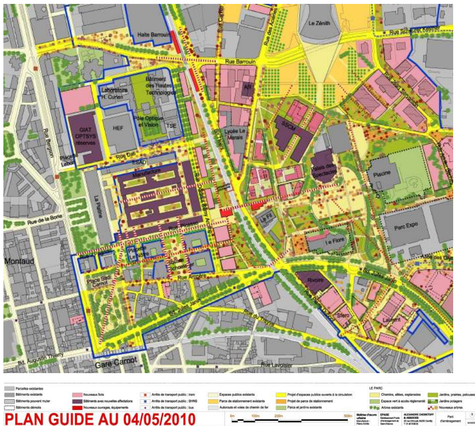
Figure 2. Plan guide de la Manufacture Plaine Achille, montrant les équipements structurants du quartier.