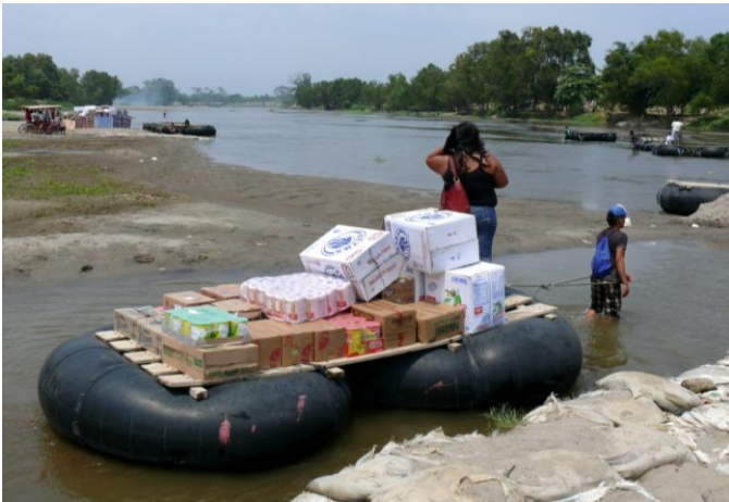
Image 2 : une usagère retournant au Guatemala après avoir fait ses achats à Ciudad Hidalgo. Photo personnelle, mars 2013.

On trouve donc, aux abords du pont international, différents lieux de passage irrégulier – il y en a cinq principaux entre les deux localités, et d'autres plus isolés et moins concourus en amont en aval – où opèrent ces organisations de balseros . La segmentation de la rive du fleuve en micro-espaces de travail et la définition de couloirs fluviaux constitue le produit de la relation et des interactions entre les différents groupes qui sont à la fois en compétition, mais également dans l'obligation d'instaurer une certaine coopération. Nous y reviendrons ultérieurement.