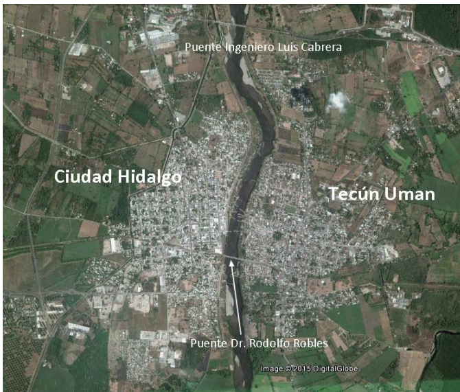
Image 1 : Vue satellite des deux localités frontalières.

D'un point de vue historique, il est important de souligner que Ciudad Hidalgo est née suite à un phénomène de dépeuplement de la municipalité d'Ayutla qui a eu lieu à partir de 1882 lorsqu'ont été signés les accords définitifs portant sur le tracé des limites entre le Mexique et le Guatemala. Précédemment Ayutla intégrait la région du Soconusco au Chiapas, mais elle est devenue, suite aux arrangements limitrophes de 1882 (qui entrent en vigueur 10 ans plus tard), une municipalité du département de San Marcos au Guatemala. C'est précisément pendant cette période qu'une partie des habitants d'Ayutla, non conformes aux dispositions du traité, ont décidé de s'établir au Mexique, le considérant comme leur pays d'origine. Ils ont alors créé un nouveau peuplement de l'autre côté du fleuve qui allait devenir l'actuelle Ciudad Hidalgo. D'hameau, elle est passée progressivement à la catégorie de village, puis de petite ville, à mesure qu'a augmenté la croissance démographique liée à une demande toujours plus importante de services relatifs au transit international.