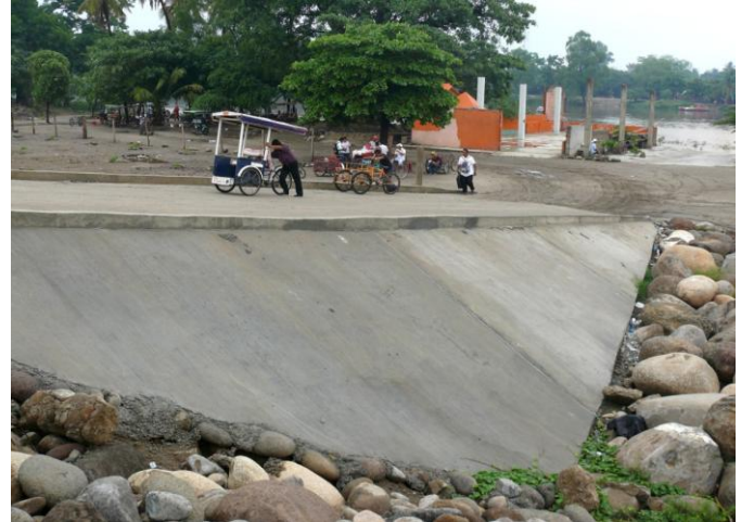
Image 8 : Rampe d'accès en béton permettant l'accès à la rive. Photo personnelle, avril 2013.

À la suite d'autres négociations, tous les lieux informels de transit sont rétablis et les accès à la rive du fleuve sont reconfigurés : en 2012, en période de campagne électorale, sont construites des rampes d'accès pour que les piétons, les tricycles, et également les véhicules motorisés puissent passer le mur de soutènement et gagner la rive du fleuve. Signalons que le principal argument des diverses organisations a été celui du respect des « us et coutumes » ; en effet, l'État mexicain reconnaît dans sa constitution certaines formes d'autogouvernement et coutumes (qui prévalent dans la plupart des cas dans des communautés indigènes).