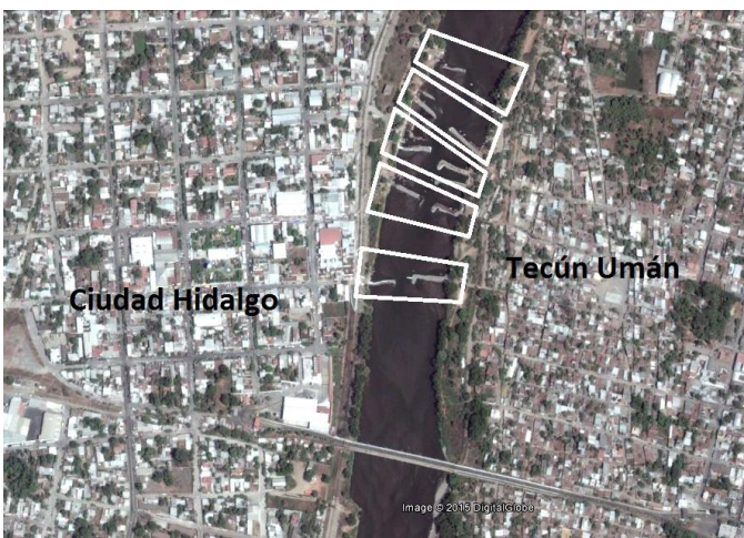
Image 3 : les différents lieux de passage en marge du pont international.

On trouve donc, aux abords du pont international, différents lieux de passage irrégulier – il y en a cinq principaux entre les deux localités, et d'autres plus isolés et moins concourus en amont en aval – où opèrent ces organisations de balseros . La segmentation de la rive du fleuve en micro-espaces de travail et la définition de couloirs fluviaux constitue le produit de la relation et des interactions entre les différents groupes qui sont à la fois en compétition, mais également dans l'obligation d'instaurer une certaine coopération. Nous y reviendrons ultérieurement.