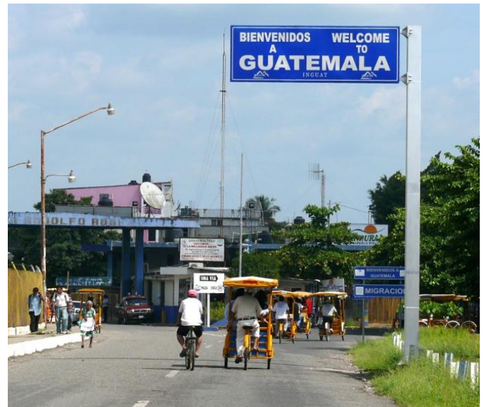
Image 4 et 5 (ci-après) : l'entrée à Tecún Umán depuis l'un des principaux lieux de passage informel aménagé antérieurement à la construction des ponts internationaux (à gauche) ; arrivée à Tecún Umán par le pont international Dr. Rodolfo Robles (à droite).

À partir des années quatre-vingt et quatre-vingt-dix, le gouvernement mexicain durcit le ton, ce qui n'est pas sans rapports avec l'intensification des flux migratoires et commerciaux, les améliorations quant aux transports et communications (qui ouvrent de nouvelles possibilités de mobilité transnationale), et les programmes bilatéraux de coopération avec les États-Unis en matière de sécurité et de défense. Dès lors, certaines pratiques, largement tolérées durant des décennies, sont devenues répréhensibles et ont été de ce fait périodiquement sanctionnées 10 . Toutefois, si celles-ci sont dévalorisées dans les discours de l'État national à partir d'un moment donné, elles sont restées empreintes de normalité pour la population locale, d'autant plus qu'il y a un phénomène de reproduction sociale de ces pratiques de génération en génération depuis presque un siècle, à l'image de