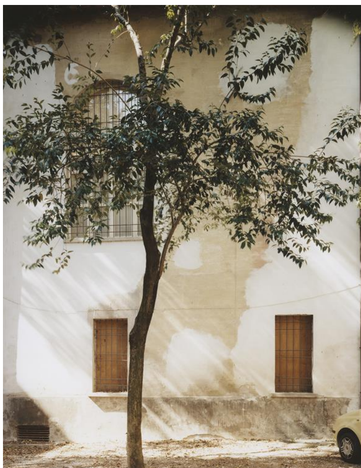
1- Liceo Torricelli: cortile interno.

Luogo iconico-simbolico per eccellenza, dedito agli studi classici dal 1623 ma con sezione scientifica annessa, il Liceo Torricelli è studiato e vivisezionato da queste stampe cromogeniche di modeste dimensioni: fotografie senz'aura, che mostrano intatto il delitto della conoscenza, di quella conoscenza eccessiva, strabordante, sistematica, così profondamente inappropriata ad un'epoca dai "caratteri limitati", e così impossibile da mantenere (nelle sue sedi, troppo care da ristrutturare, e nelle sue leve, non più integrabili nel "mondo del lavoro").