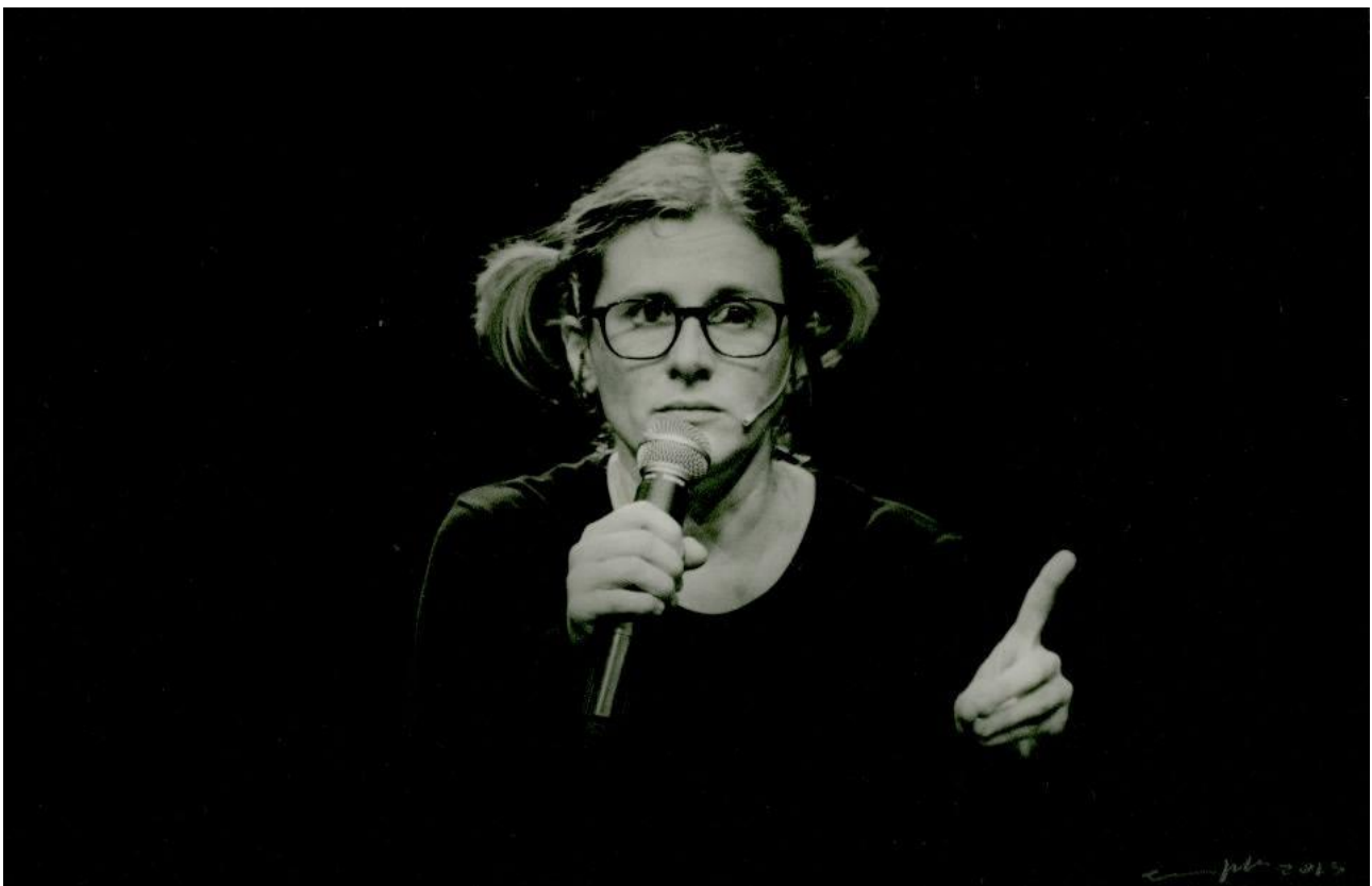
Discorso giallo, foto © Enrico Fedrigoli

Dà i brivicci, al primo ascolto, quel susseguirsi di voci bambine. Ci ricordano qualcosa che non sempre possiamo ricordare: come abbiamo appreso, quando ancora non sapevamo apprendere? Neppure siamo abituati a interrogare gli alunni sui metodi educativi cui vengono esposti, quei metodi così velocemente introiettati. Come punirebbe un bambino? Quanto è consapevole dei sistemi educativi cui prende parte, delle convenzioni linguistiche da lui stesso messe in atto? Il banco di prova è, ancora una volta, quel mostro sconosciuto, il primo e il più difficile da educare, quel gorilla portato in aula che “gesticola troppo, non sa stare fermo, non lo conosciamo”, non può pensare di apparire allo spettatore senza produrre spavento.