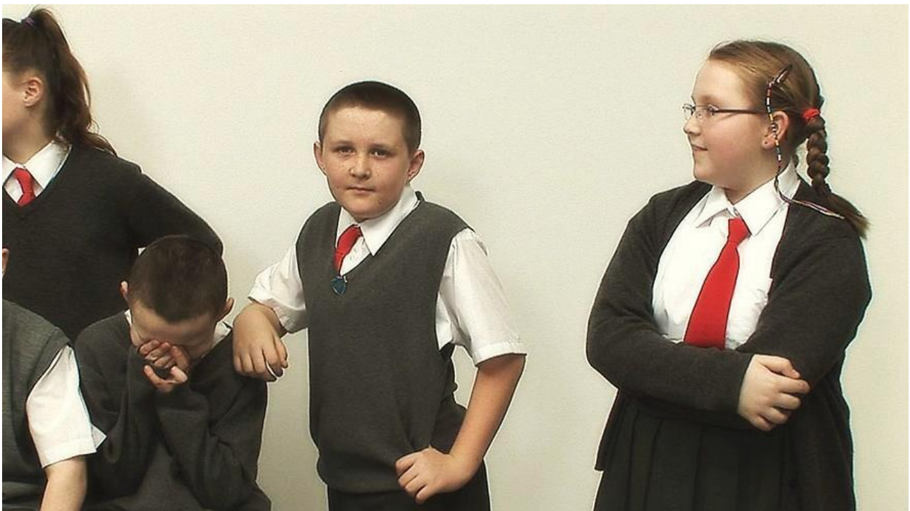
RINEKE DIJKSTRA: materiali per Discorso Giallo.