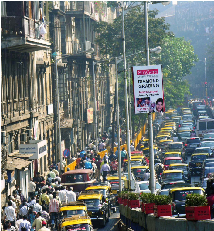
Image 4 : Accroître rapidement l'offre viaire en multipliant les autoponts : le cas de Mumbai