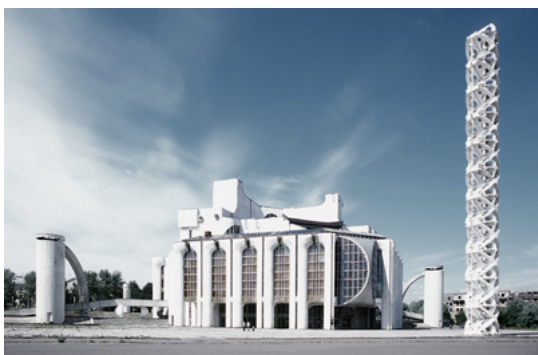
© Andrei Rozen, The Novgorod Theatre

che compensa le imperfezioni degli spazi ordinari (le colonie delle società puritane nel XVII secolo, o quelle dei gesuiti in Paraguay, di cui Foucault parlerà anche altrove). La nave, luogo in perenne transito «qui vit par lui-même», è detta infine l’eterotopia per eccellenza, «la plus grande réserve d’imagination» 11 .