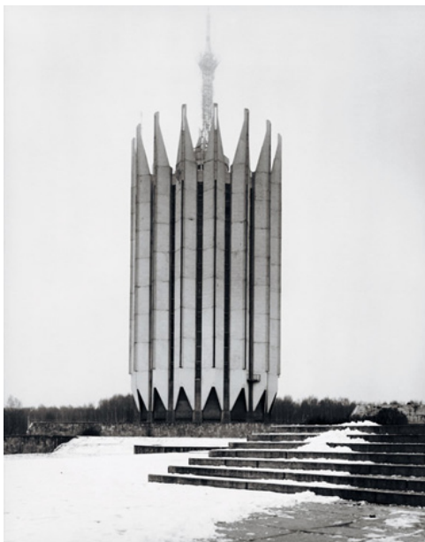
© Frédéric Chabin, Istituto di Robotica e Tecnica Cibernetica

Nella nota conferenza tunisina del '67, Foucault includeva tra gli "spazi altri" luoghi inusuali o marginali, in cui la nostra percezione dell'ordine sociale può farsi, a volte, più acuta. Gli spazi citati in quella sede diventarono, nel giro di qualche anno, la mira privilegiata delle sue acinote analisi sull' aménagement disciplinare e biopolitico. Ciononostante, il tono della conferenza appare neutrale e quasi elogiativo, sostiene McLeod. I luoghi in questione entrano in relazione con tutti gli altri spazi, eppure li contraddicono, poiché