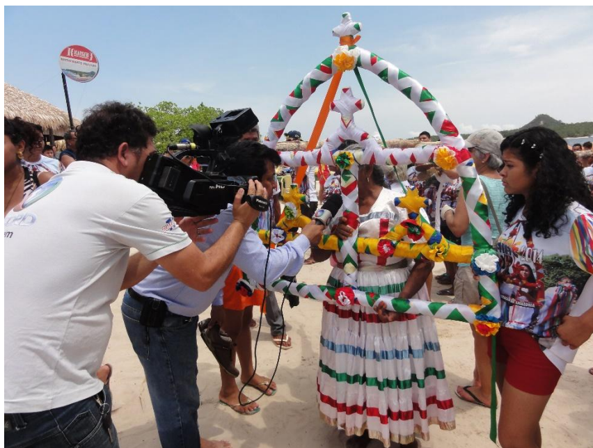
Fotografia da autora

Sobre a história da festa, a literatura científica dedicada costuma ressaltar o contraste entre o que se iniciou como uma manifestação religiosa criada pelos jesuítas no século XVII para evangelizar os índios aldeados (CANTO 2014) 4 e celebrada na Amazônia toda ainda no século XIX 5 , e o “espetáculo massivo” (AZEVEDO 2002) associado ao único nome de Alter do Chão em que se tornou nos anos 2000. No caso desta vila, apontam para um momento de ruptura com grandes incidências sobre os atuais contornos da festa, i.e., a proibição da sua celebração por 30 anos por frades estrangeiros, de 1943 a 1973. É nesta última data, coincidindo com a chegada dos primeiros turistas, que os moradores “reativam” o Sairé, agregando-lhe novas diversões, entre as quais a do boto. O espetáculo da “disputa” se autonomiza progressivamente do “rito” no fim dos anos 1990 quando a prefeitura de Santarém aumenta de modo significativo a sua participação financeira e que o evento é divulgado todo ano nas ondas de uma TV local. Com o desenvolvimento do turismo, a parte “profana” do Sairé acaba superando a parte “religiosa” em termos de atração, o que provoca fortes tensões entre os defensores do “rito” e os promotores do “boto” que têm visões divergentes do que deveria ser o Sairé.