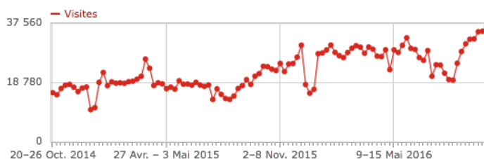
Fig. 4. Décompte des visites hebdomadaires sur Mes Aides d'octobre 2014 à octobre 2016. Les creux sont les vacances scolaires.

Ces éléments, ainsi que le nombre toujours croissant d'utilisateurs en l'absence de communication, semblent montrer que Mes Aides remplit effectivement sa mission de réduire l'effort d'évaluation des droits aux aides sociales.