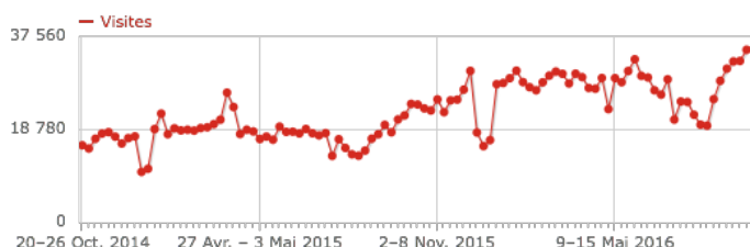
Fig. 4. Décompte des visites hebdomadaires sur Mes Aides d'octobre 2014 à octobre 2016. Les creux sont les vacances scolaires.

Ces éléments, ainsi que le nombre toujours croissant d'utilisateurs en l'absence de communication, semblent montrer que Mes Aides remplit effectivement sa mission de réduire l'effort d'évaluation des droits aux aides sociales.