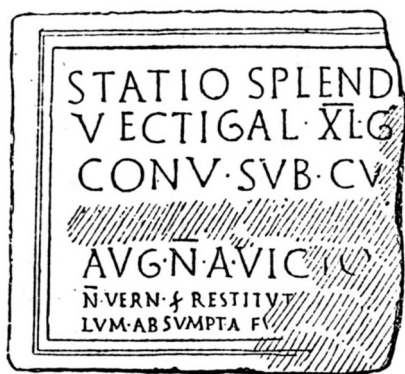
Fig. 2. Dessin de l'inscription dans J. Sacaze, Inscriptions antiques des Pyrénées , Toulouse, 1892, n°80.

D'après l'examen de la pierre, on peut transcrire le texte de la façon suivante :