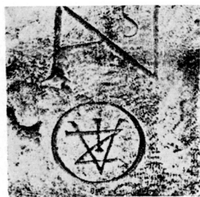
Fig. 4. (d'après IMS, VI, 212).

À Saint-Bertrand, le signe utilisé (le dernier à droite sur le tableau) ressemble plus à une ligature et même à un monogramme combinant les trois lettres CTS, ou bien un C et un S barré, qu'à une abréviation épigraphique proprement dite. On peut d'ailleurs supposer que c'est le genre de monogramme qui était utilisé dans la paperasse de la station, pour indiquer le titre de l'agent qui rédigeait ou était désigné dans les pièces. On trouve dans une des inscriptions que nous venons de citer, et qui provient de Lopate en Mésie supérieure, deux monogrammes du même genre représentant le nom de l'agent, A(pollo)n(ide)s , et celui de la station, au génitif, Viz(iani) (fig. 4) 34 .