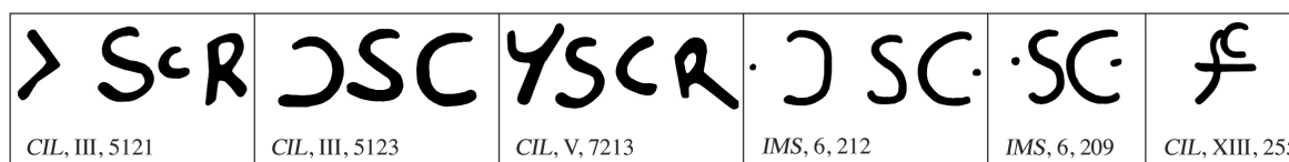
Fig. 3 (dessin N. Pexoto, Institut Ausonius).

À Saint-Bertrand, le signe utilisé (le dernier à droite sur le tableau) ressemble plus à une ligature et même à un monogramme combinant les trois lettres CTS, ou bien un C et un S barré, qu'à une abréviation épigraphique proprement dite. On peut d'ailleurs supposer que c'est le genre de monogramme qui était utilisé dans la paperasse de la station, pour indiquer le titre de l'agent qui rédigeait ou était désigné dans les pièces. On trouve dans une des inscriptions que nous venons de citer, et qui provient de Lopate en Mésie supérieure, deux monogrammes du même genre représentant le nom de l'agent, A(pollo)n(ide)s , et celui de la station, au génitif, Viz(iani) (fig. 4) 34 .