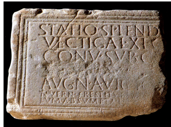
Fig. 1. L'inscription CIL , XIII, 255.

L'inscription est gravée sur une belle plaque, brisée à droite, en marbre de Saint-Béat (hauteur : 43 cm ; largeur conservée : 47,5 cm ; épaisseur : 6,1 cm en bas, 7,5 en haut) 5 . Le champ épigraphique prend place dans un cadre bordé par une triple moulure (hauteur : 32,7 cm ; largeur conservée dans la partie supérieure : 42,5 cm). La gravure des lettres est fine et profonde, l'écriture est soignée, de même que la mise en page régulièrement centrée (hauteur des lettres : 4 cm aux lignes 1-5, 2 cm aux lignes 6-7 ; hauteur moyenne des interlignes : 0,8 cm). La partie conservée du champ épigraphique est en bon état, mise à part l'extrémité droite qui montre une usure affectant de manière croissante toute la fin des lignes 2 à 7. La ligne 4 a été complètement martelée et son texte a disparu. La plaque est réputée avoir été découverte à Saint-Bertrand vers le milieu du XIX e siècle (on reviendra bientôt sur ce point), et elle est conservée dans les réserves du Musée Saint-Raymond de Toulouse. D'après L. Maurin, il y en avait un moulage au musée national des douanes à Bordeaux, mais il semble avoir disparu.