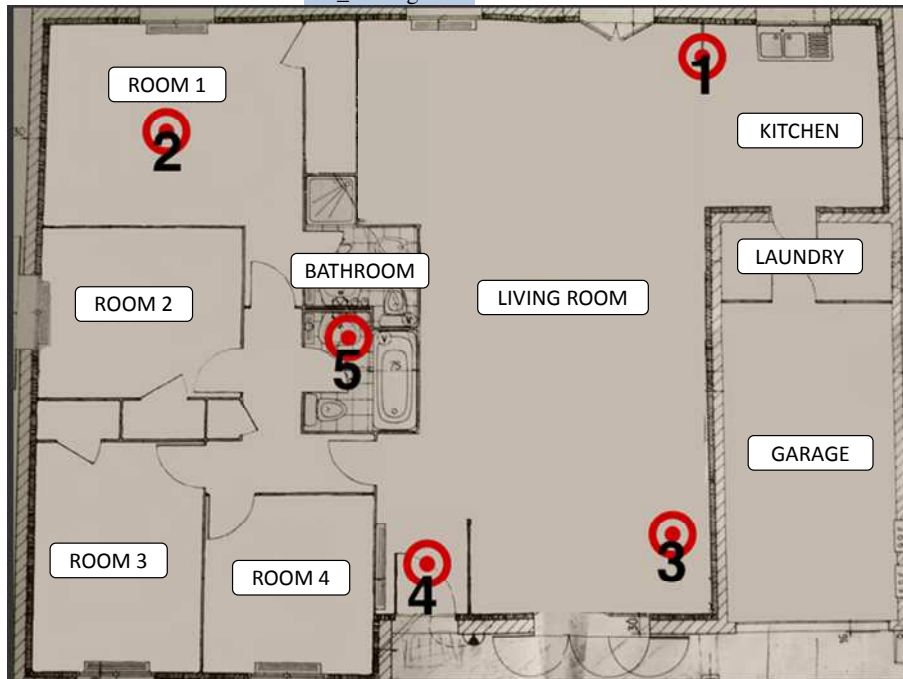
Figure 2. Implantation des 5 Footbots dans la maison