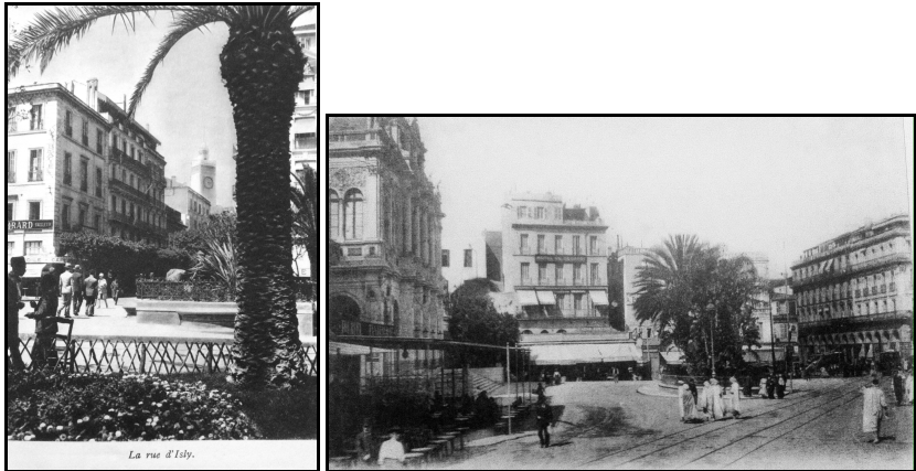
Figure 1 La rue d'Isly et la tour des Galeries de France depuis la place d'Isly. Photo M.Bertault, In Chollier 1929 p. 38