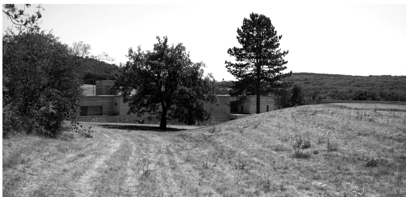
Figure 3 : Photographie de la maison Grachaux, Antoine Bégel