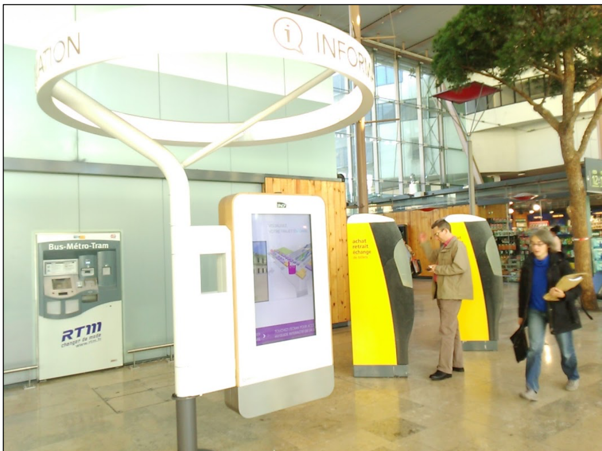
Dispositif d'information gare Saint Charles Marseille novembre 2015

Le développement technologique des terminaux mobiles et des applis conduit à un partenariat renouvelé entre opérateur de mobilité et les acteurs du numérique pour définir des modèles économiques, mais aussi équilibrer les rôles de chaque grand opérateur. L'objectif central est bien d'éviter la désintermédiation. En outre, avec l'ouverture des données et le recours à des moyens de calcul beaucoup plus élaborés, les acteurs publics de la mobilité d'une part, les acteurs du commerce en gare de l'autre cherchent à connaître avec finesse les comportements et fidéliser la clientèle qui fréquente les gares au quotidien dans une perspective plus multimodale, mais aussi à mieux profiler les consommateurs à des fins de marketing ciblé.