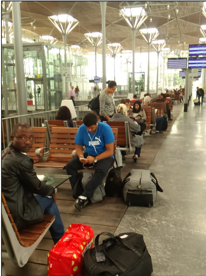
Gare de Casa Port, Casablanca, octobre 2015, N. BARON