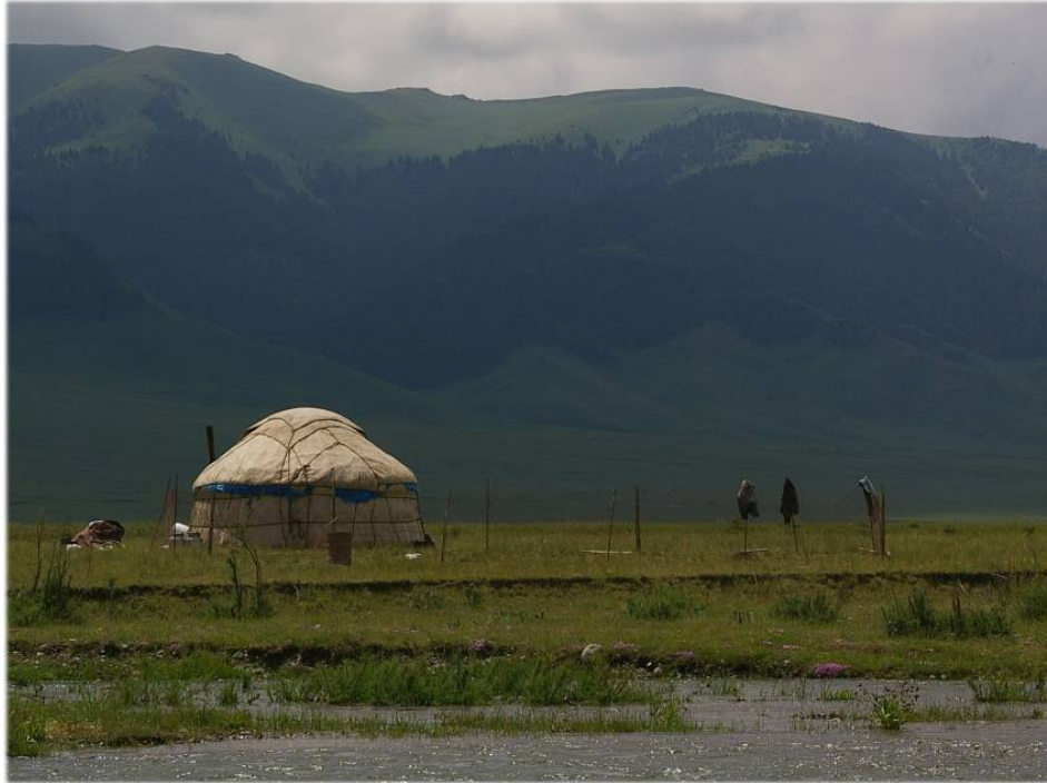
Vêtements posés sur les piquets de l'enclos à moutons faisant office d'épouvantails à loups (à droite de la iourte)

Kazakhstan, région d'Almaty, district de Rajymbek, juin 2012