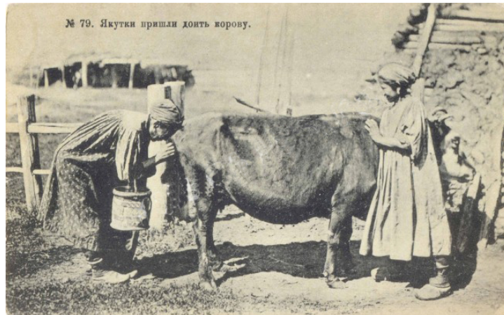
Traite des vaches avec kupčuur ou insufflation Iakoutie, carte postale 1910

Un autre procédé consistait à souffler dans le vagin en appliquant les lèvres sur la vulve p.82 (Trošanskij, 1911 : 83 ; Seroševskij, 1993 [1896] : 154). Cette technique d'insufflation accompagnant la traite est attestée de longue date en Afrique saharienne, de l'Est et du Sud, ainsi qu'en Inde, en Europe de l'Est, en Irlande ou en Alsace (Le Quellec, 2011) et sporadiquement en Chine (Huston Edgar, 1924). Chez les Scythes, Hérodote explique que les esclaves voués à la traite des juments :