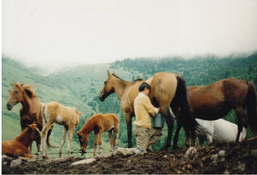
Traite par un jeune éleveur de chevaux près du poulain attaché au želi Kazakhstan, région d'Almaty, district de Rajymbek, juillet 1994.