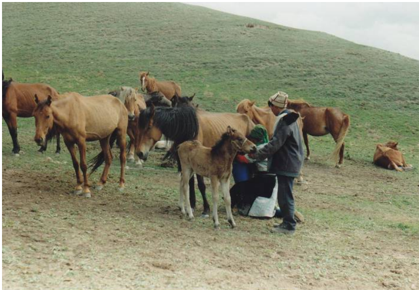
Traite par une femme, tandis qu'un garçon tient le poulain devant la jument Kirghizstan, région de Naryn, mai 1994.

Les juments sont traites quatre à huit fois par jour, principalement en été, par des hommes ou par des femmes, qui se tiennent à leur gauche, le genou droit à terre. Le lait de jument, longuement battu, fermente et se transforme en kumys , une boisson légèrement alcoolisée très appréciée. Les vaches sont traites tout au long de l'année, jusqu'au mois précédent le vêlage suivant, deux fois par jour, de préférence par des femmes assises à leur droite sur un petit tabouret.