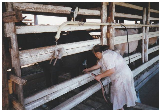
Traite à l'aide d'une trayeuse électrique

Sous le régime soviétique, la traite a été en partie mécanisée. Symboles du progrès, les trayeuses électriques représentaient un bouleversement non seulement parce qu'elles allégeaient la corvée de la traite, mais aussi parce que la mulsion s'effectuait sans la participation du poulain. Destinées à rendre obsolète la traite manuelle (Barmincev & al. 1980 : 182, 184), elles demeurèrent néanmoins très minoritaires.