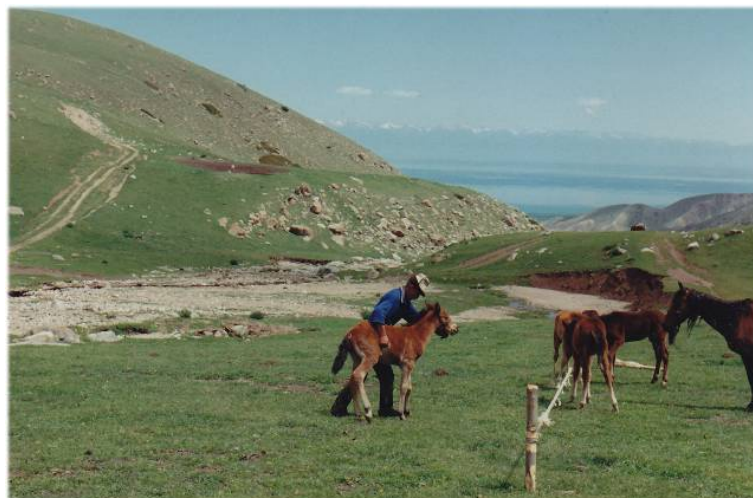
Capture des poulains pour la première traite Kirghizstan, région de l'Issyk-koul, juin 1994