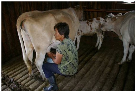
Traite des vaches

dans le iak. boton « étable », après la sucée du veau ensuite attaché devant sa mère. Iakoutie, ulus d'Ust'-Aldan, août 2008