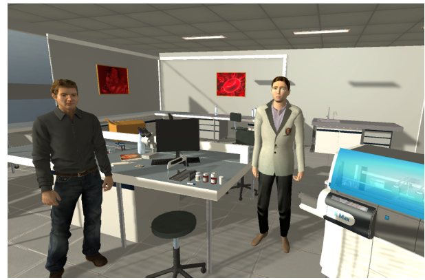
Figure 3: Scène intégrant deux ACAs (Virtual Human Toolkit et GRETA)

Les ITS classiques sont composés du modèle du domaine, du modèle pédagogique et du modèle de l'apprenant. Le modèle du domaine est représenté par l'environnement virtuel informé. Il représente la base de connaissances de l'agent qui lui fournit des connaissances sur les procédures du domaine, les actions et les états des entités. Le modèle pédagogique est représenté