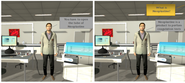
Figure 4: Scène extraite de la procédure d'utilisation de l'automate.

un objet, si l'apprenant fronce les sourcils (ou exprime un feedback négative), le tuteur peut décider de fournir plus d'informations, par exemple, il peut expliquer le rôle de l'objet. A chaque instant le comportement du tuteur peut être affecté par une interruption de l'apprenant. L'apprenant peut interagir avec l'environnement ou avec le tuteur, en réalisant une action du domaine. Après chaque action du domaine faite par l'apprenant, le tuteur vérifie si l'action effectuée et l'objet manipulé sont corrects. Selon le résultat de cette vérification et selon le modèle de l'apprenant, le tuteur peut choisir d'émettre un feedback . Par exemple, lorsque le tuteur sait que la prochaine action que l'apprenant doit réaliser est de manipuler un objet O1, mais l'apprenant manipule l'objet O2, le tuteur peut montrer un feedback négative, par exemple il pourrait dire "c'est faux", ou simplement froncer les sourcils.