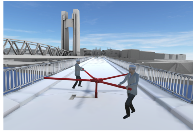
Figure 5: Scène extraite de la procédure d'ouverture de l'ancien pont tournant de Brest.

l'apprenant pour réaliser une procédure. Cette procédure fait intervenir des actions sur l'automate qui se trouve à la gauche de l'agent, (faire fonctionner la machine, ouvrir le tiroir, etc.) et des actions de préparation des réactifs qui sont positionnés à sa droite sur la pailasse (les flacons, les tubes à essai, etc.).