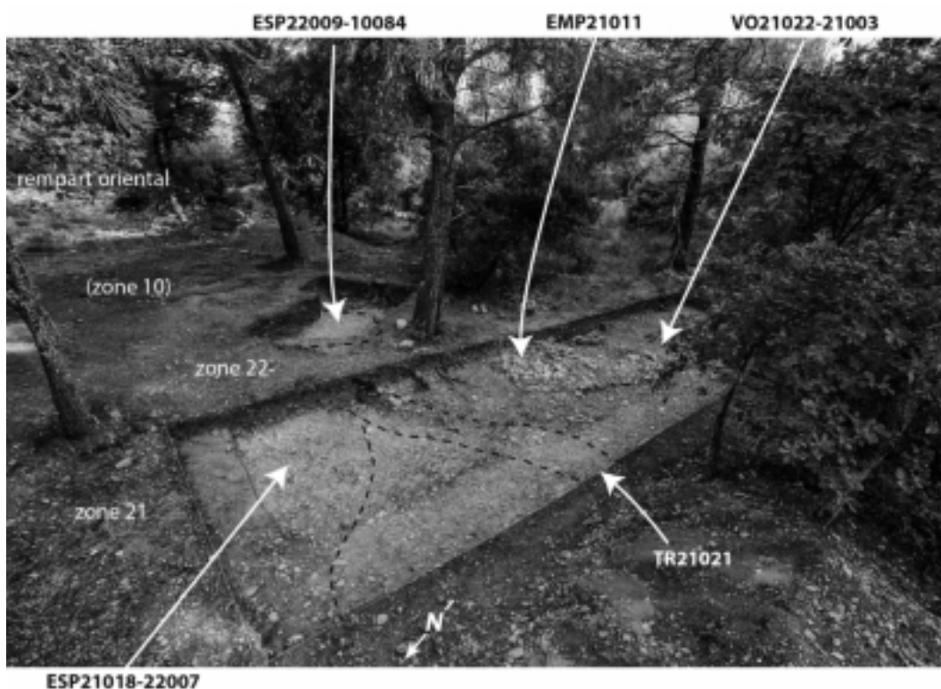
Fig. 173 – CADENET, Castellar. Vue des cinq ensembles (zones 21-22) : ESP22009-10084 : structure bâtie de la fin du deuxième âge du Fer ; EMP21011 : soubassement empierré antique ; VO21022-21003 : voirie ; ESP21018-22007 : vestige d'occupation de la fin du deuxième âge du Fer ; TR21021 : tranchée antique.

Au final, nous avons là des vestiges de structures bâties qui se succèdent dans le temps, sans interruption, de la fin du II e -I er s. av. J.-C. au Haut-Empire. Une continuité d'occupation intéressante entre l'âge du Fer (période de fondation du site, de construction du système défensif) avec une phase d'occupation postérieure au changement d'ère qui, à ce jour, n'était connue qu'au sommet du rempart (zone 4, nord-est du site, sur l' agger ). Il y a donc un bâti intra-muros postérieur à la Protohistoire, qui va dans le sens des découvertes anciennes, même si sa nature exacte pose encore problème (en raison de l'état de conservation général du site).