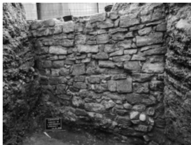
Fig. 175 – CARPENTRAS, parking de l'Observance. Sondage 8 : vue du mur de soutènement.

Le sondage 8 a également livré les vestiges d'un second mur axé nord-sud (fig. 175). Cette structure, d'environ 0,60 m de large, conservée sur une hauteur d'une