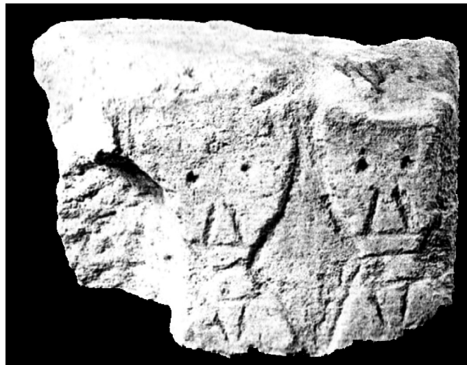
■ 5 Bloc à têtes gravées de Badasset (Vernègues, 13) (Bringer, Dumont-Castells 2000).

À gauche, bloc découvert en 1963 ( Gallia 1964, 559, fig. 20) ; à droite, bloc de 1963 et bloc de 1956 ( Vève 2005, fig. 20).