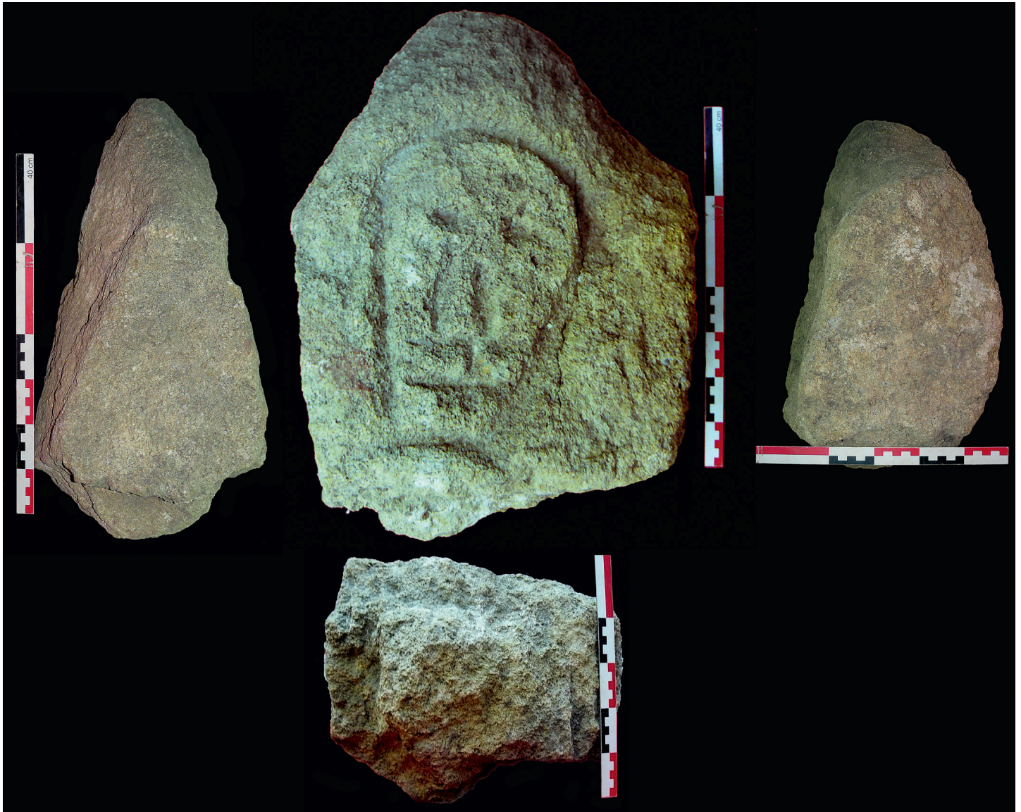
■ 1 Photographies du bloc (cl. : D. Isoardi, juin 2011).