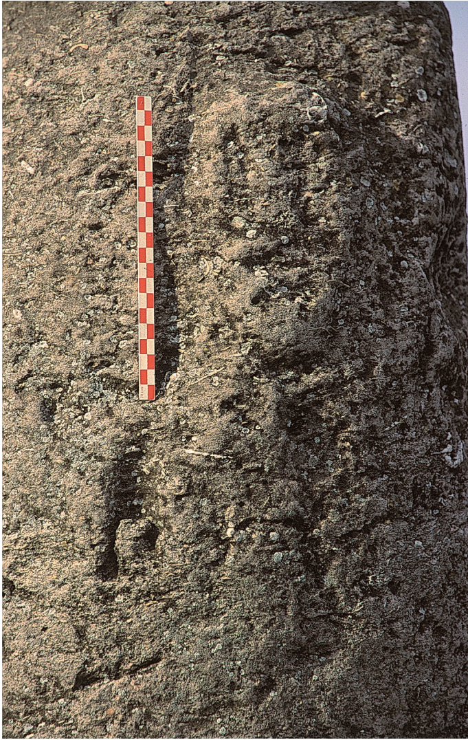
■ 6 Tête gravée en bas-relief sur une colonne calcaire, oppidum de Saint-Pierre de Martigues (13) (Chausserie-Laprée 2009, 52).

fin, appartenant à un ou plusieurs portiques cultuels, décorés d'entailles céphaloïdes, mais aussi de gravures, de bas-reliefs, et sans doute de motifs peints. Ils sont réutilisés pour l'essentiel comme stylobate de façade, bases de pilier et banquette dans l'aménagement de la salle hypostyle de l'habitat 2. D'autres fragments sont intégrés dans le radier de la voie 6 et dans les murs de proximité, ces derniers provenant d'un groupe sculpté en ronde bosse. À ces éléments de portiques s'ajoutent des fragments de stèles quadrangulaires, non chanfreinées et à base rustique. Nous retenons en particulier le pilier à têtes gravées employé en stylobate de la salle hypostyle (fig. 7). Le type de gravure diffère un peu de celui du Castellar (ce n'est pas une simple rainure), mais le style est très proche : tête gravée schématisée avec nez trapézoïdal, bouche droite, menton rectiligne (les yeux sont seulement figurés par un trait ici).