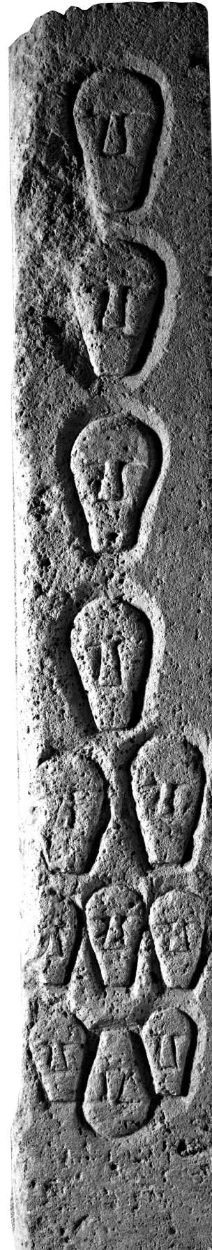
■ 7 Pilier à tête gravée, Entremont (Aix-en-Provence, 13)

fin, appartenant à un ou plusieurs portiques cultuels, décorés d'entailles céphaloïdes, mais aussi de gravures, de bas-reliefs, et sans doute de motifs peints. Ils sont réutilisés pour l'essentiel comme stylobate de façade, bases de pilier et banquette dans l'aménagement de la salle hypostyle de l'habitat 2. D'autres fragments sont intégrés dans le radier de la voie 6 et dans les murs de proximité, ces derniers provenant d'un groupe sculpté en ronde bosse. À ces éléments de portiques s'ajoutent des fragments de stèles quadrangulaires, non chanfreinées et à base rustique. Nous retenons en particulier le pilier à têtes gravées employé en stylobate de la salle hypostyle (fig. 7). Le type de gravure diffère un peu de celui du Castellar (ce n'est pas une simple rainure), mais le style est très proche : tête gravée schématisée avec nez trapézoïdal, bouche droite, menton rectiligne (les yeux sont seulement figurés par un trait ici).