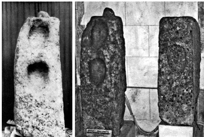
■ 4 Piliers ou stèles à entailles céphaloïdes du Castellar (conservés au Musée de Cavaillon, 84).

À gauche, bloc découvert en 1963 ( Gallia 1964, 559, fig. 20) ; à droite, bloc de 1963 et bloc de 1956 ( Vève 2005, fig. 20).