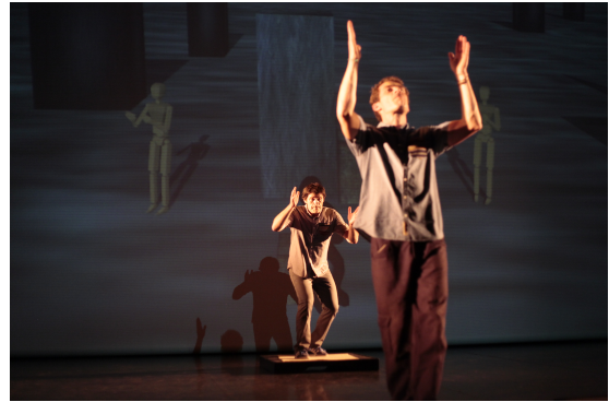
Figure 2: Les artistes et l'agent jouent ensemble lors de la répétition générale du spectacle.