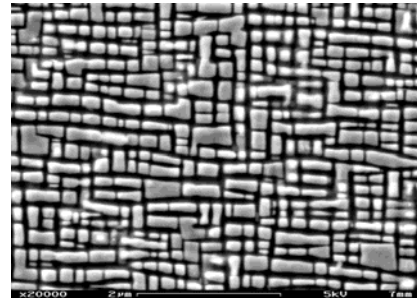
Figure 3. Précipitation de la phase \gamma' dans l'alliage CoNi-02 après un revenu de 96h à 900°C (MEB/électrons secondaires – attaque électrochimique).

Dans les superalliages polycristallins à base de nickel tel que le N18, des précipités \gamma' de trempe de taille supérieure à 100 nm sont observés pour des vitesses de refroidissement supérieures à 600°C/min après traitement à haute température [10]. Pour les alliages CoNi-0x, de très fins précipités n'ont pu être observés avec certitude qu'à partir des échantillons ayant subi un revenu de 24 heures à 700°C. Au-delà de cette température, des précipités sont observés et leur taille varie de < 30 nm (700°C/24h) jusqu'à 400-450 nm (1000°C/96h). Un exemple de précipitation \gamma' est présenté dans la Figure 3 pour le revenu de 96 heures à 900°C. La taille des précipités est de l'ordre de 200-250 nm et la fraction surfacique d'environ 53%.