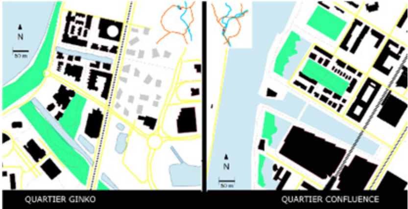
Figure 1. Situation géographique et zoom sur les quartiers

quartier de Confluence est aménagé sur la presqu'île de Lyon entre les fleuves du Rhône et de la Saône et le quartier de Ginko sur les berges du Lac de Bordeaux (lac artificiel aménagé dans les années 1960-1970 pour prévenir les inondations). L'étude réalisée porte plus précisément sur ces espaces à l'intérieur de ces quartiers qui ne sont qu'en partie achevés (Fig. 1).