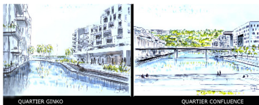
Figure 3. Marcher sur l'eau, s'asseoir au bord de l'eau et voir l'eau au loin (Ginko) et marcher et s'asseoir au bord de l'eau (Confluence)

La mise en scène de l'eau prend différentes formes et amène différentes ambiances (Fig. 2 et 3). Marcher avec la vue sur l'eau (le lac ou le fleuve et leurs berges),