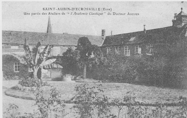
Fig. 2. Les établissements Auzoux à Saint-Aubin-d'Escroville. Carte postale, collection de l'auteur.

Il faut attendre un autre Normand, le docteur Louis Auzoux 11 , pour voir un mannequin soulever l'enthousiasme de la communauté médicale pour de nombreuses années. Né à Saint-Aubin-d'Escroville le 7 avril 1797, d'une famille de cultivateurs, il suit des études