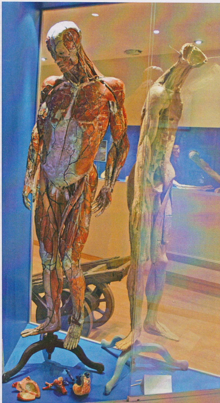
Fig. 1. Grand mannequin anatomique Auzoux conservé au musée de l'Écorché d'anatomie du Neubourg.