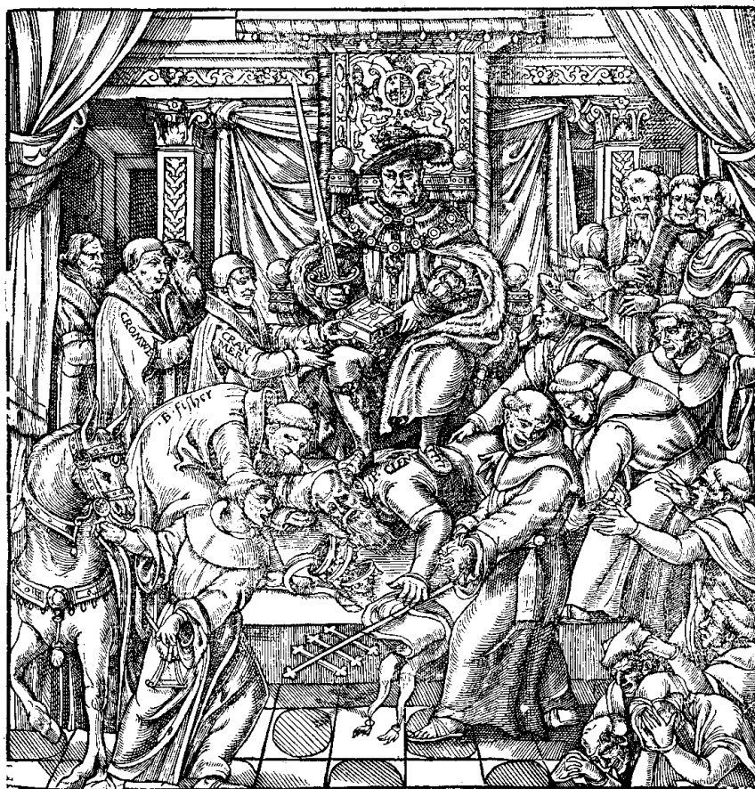
John FOXE, Actes and Monuments of these Latter and Perillous Days, Touching Matters of the Church , Londres, 1653, livre 2.