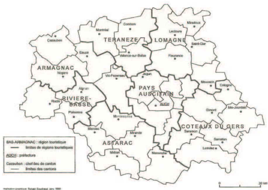
Figure 3 : Les régions touristiques du Gers.