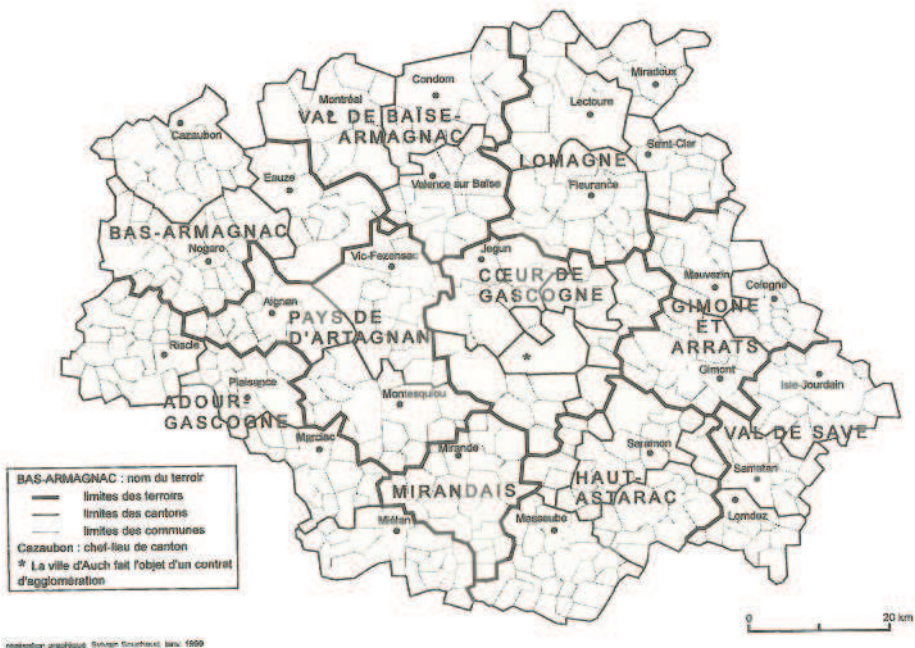
Figure 4 : Les contrats de terroirs du Gers.