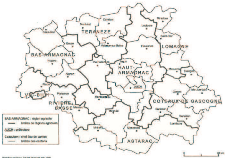
Figure 2 : Les régions agricoles du Gers.