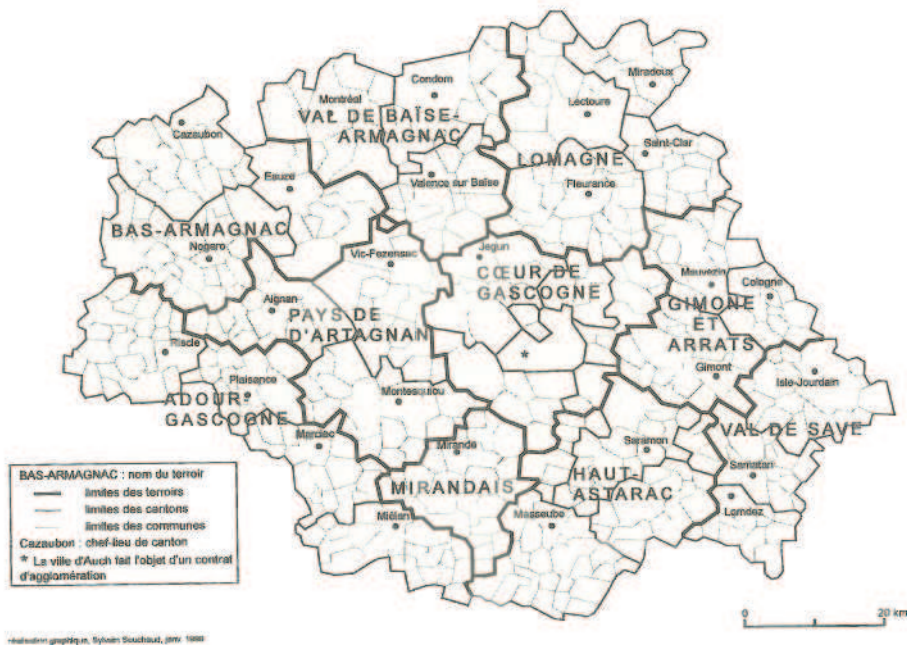
Figure 5 : Les peuplements des terroirs gersois.