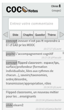
Fig. 1. L'interface de COCoNotes Live