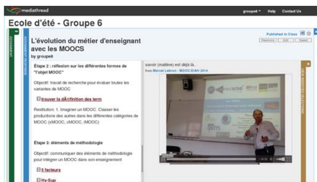
Fig. 2. L'interface de MediaThread

Les outils proposés afin de prendre des notes puis de les réutiliser sont les suivants. COCoNotes Live 1 (Fig. 1) est un outil (développé par notre équipe) de microblogging privé, consistant en une interface Web liée à un serveur. Il permet de classer les notes - soit par catégories prédéfinies, soit par des catégories définies par l'utilisateur - ainsi que de synchroniser les notes avec l'enregistrement de l'événement. Mediathread 2 (Fig. 2) est une plateforme open-source permettant d'écrire des textes liés à des