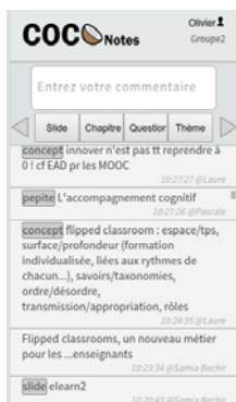
Fig. 1. L'interface de COCoNotes Live