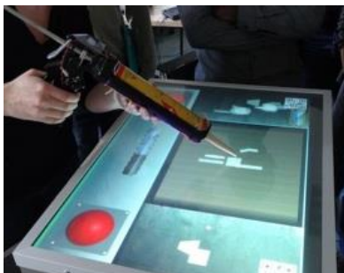
Fig. 2. Le projet SEGAREM est un projet visant à développer des outils de réalité mixte comme support à l'apprentissage. Un des prototypes réalisés offre la possibilité à un apprenant d'utiliser un objet physique (un pistolet à colle) face à un écran qui représentera la colle virtuellement appliquée.