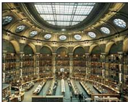
La salle Ovale, BnF-site Richelieu