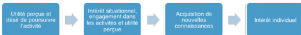
Figure 1 : Présentation des quatre étapes du modèle développement de l'intérêt personnel de Suzanne Hidi et K. Ann Renninger (2006)

15 Développer l'intérêt situationnel est un moyen de développer l'intérêt personnel : ce dernier renvoie à l'intérêt de l'étudiant pour une discipline ou un domaine sur une longue période. Cet intérêt est plutôt stable dans le temps et peu sensible à des effets de contexte. L'intérêt situationnel correspond à l'intérêt que l'étudiant porte à une situation particulière de cours. Cet intérêt est très sensible au contexte, et par conséquent reste fluctuant. Il est difficile d'avoir une action directe sur l'intérêt personnel, mais ce dernier peut évoluer sur la base d'un intérêt situationnel comme illustré dans la figure 1 ci-dessous.