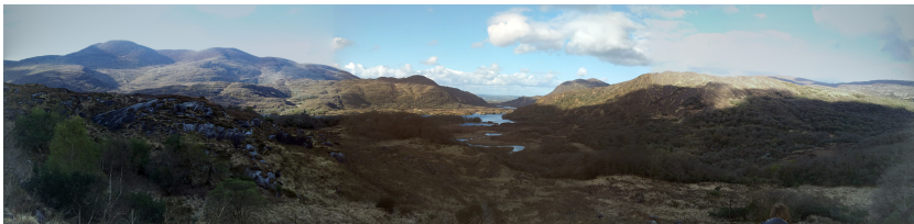
Figure 2 - Lady's view, Irlande

L'imitation indécélable, celle qui tromperait suffisamment nos sens pour qu'ils ne puissent déceler l'artifice qui les dupe, est le fantasme de l'immersion parfaite. Cela présupposerait une imitation qui s'adresserait à chacun de nos sens via des dispositifs mécaniques afin qu'aucune trace de contexte ne puisse perturber l'expérience. Cela distingue donc un espace imitant, celui qui n'est pas réel, que l'on reconnaît comme espace diégétique, de l'espace imité, qui est l'espace du vécu. L'immersion se doit de nous plonger complètement dans l'espace diégétique par tous nos sens. De fait, cette conception quelque peu naïve néglige les immenses capacités synesthésiques de notre attirail perceptif, apte, par compensation et substitution, à nourrir un sens par les informations d'un autre, ce, en faisant appel à la mémoire. Selon Goodman, la représentation procède du choix et si l'on cherche à imiter, l'on n'imité pas un tout, mais des éléments saillants, caractéristiques, qui font sens ou qui font sensation. La construction d'un espace immersif procède de même, si bien que la caractérisation de l'espace diégétique se fait par la mobilisation d'un jeu de références, dont en premier lieu, l'ambiance.